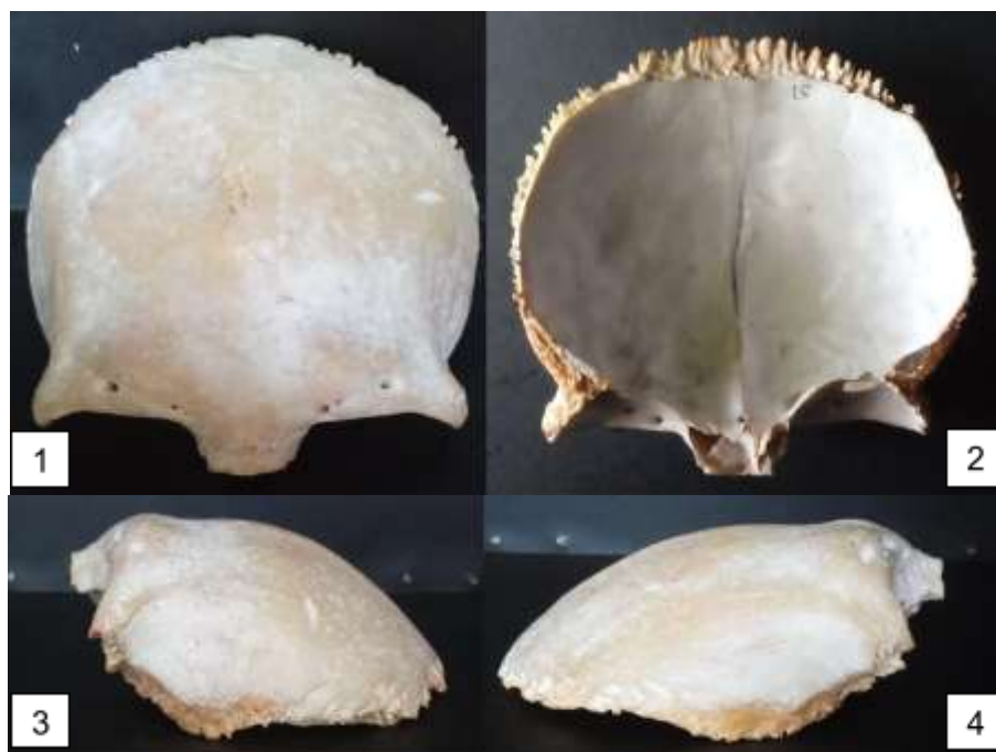
Figura 2. Face anterior e externa (1); face posterior interna (2); vista lateral esquerda (3); vista lateral direita (4).

O FSO direito mais distalizado encontra-se a 5,5 cm da margem lateral direita do osso frontal, distanciando-se 1,5 cm do forame medializado do mesmo lado, este estando a 1,6 cm da glabella; o FSO esquerdo mais distalizado encontra-se a 5 cm da margem lateral esquerda do osso frontal, distanciando-se 1,5 cm do forame medializado do mesmo lado, este estando a 1,8 cm da glabella.