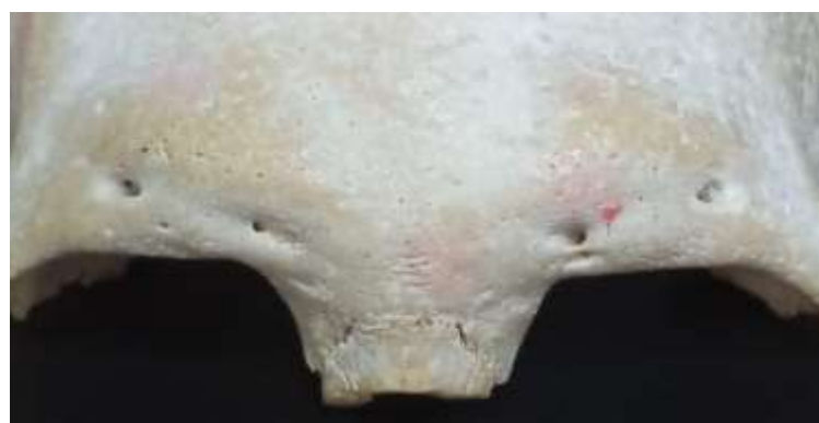
Figura 1. Vista anterior da parte descrita do osso permitindo visualização dos Forames supraorbitais.

Estão expostas fotos da peça anatômica no texto e a autorização para realização do trabalho, assim como a permissão para uso da imagem foi obtida previamente a execução do mesmo, concedida pela chefia de departamento e dos laboratórios. O osso tem 10,5 cm de altura e 11 cm de largura, está desarticulado e apresenta dois FSOs de cada lado. A seguir um detalhamento em termos de medidas: