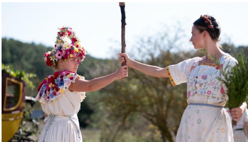
Imagem: Midsommar 2019

O Midsommar ou Midsummer , segundo Hutton (2001), representa o meio do verão e, portanto, está relacionado a uma festividade antiga importante, uma vez que representa o período do dia em que a luz solar está mais intensa em uma época em que o dia possui um período de duração maior do que a noite. Afirma-se que era um período importante e “mágico” para os povos antigos da Europa, fator representado no filme, já que, para os personagens da comunidade, a festividade era compreendida como um momento “único” do ano e, por isso, celebrava-se durante nove dias. Langer (2015) explica que o número nove trata-se de símbolo recorrente e importante para o mundo germânico, tendo em vista que é um número que possui relação com a mitologia. O autor elucida que o número nove é retratado, no mito, em diversos momentos, sendo eles: o número de dias que o deus Odin permaneceu em seu sacrifício, para obter o conhecimento rúnico; na cosmologia nórdica, já que, para a mitologia nórdica, existem nove mundos, dentre diversos outros momentos e representações que podem ser encontradas nas fontes e estudos a respeito dessa temática.