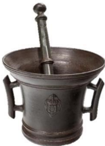
Figura 1: Almofariz do século XVIII

Foto: Daniel Mansur. Museu do Ouro/IBRAM-MINTUR-32020