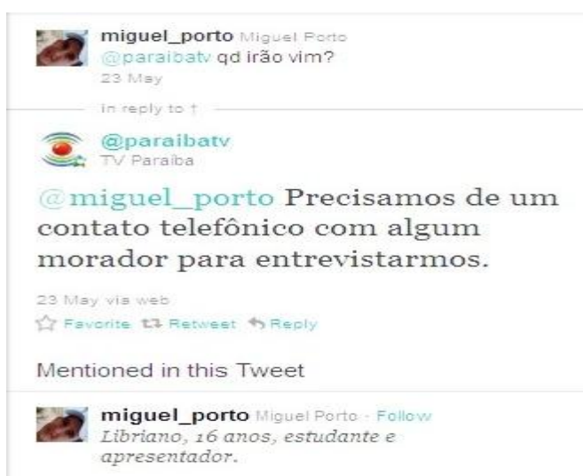
Figura 2 – Exemplos de posts realizados pelo @paraibatv em busca de personagens para produção de matérias ao trocar informações com usuários da rede.

Através desta interação, foi visível um novo espaço nos telejornais da emissora que passaram a produzir matérias com bases nas sugestões enviadas pelos internautas tuiteiros. Entre as mais comuns estão acidente/incidente como acidentes de carro, inundações, homicídios, problemas de comunidade, etc, os quais eram sempre discutidos por produtores e editores. Conforme exemplo abaixo: