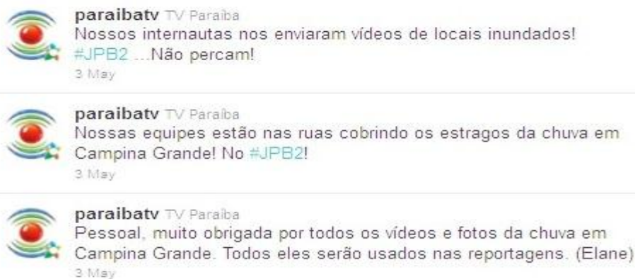
Figura 3 – Interação, agradecimento e chamada para o público conferir o telejornal com fontes da própria rede social.

Também como exemplo desta prática, temos o telejornal exibido no dia 03 de maio de 2011, em que ocorreu uma forte chuva em Campina Grande – Paraíba, deixando a cidade alagada com diversos casos de destruição. E foi através do Twitter que a rede de televisão descobriu e conseguiu pistas de locais intransitáveis e produziu matérias com base nas informações transmitidas pelos usuários, assim como divulgou fotos e vídeos publicadas pelos usuários durante a apresentação do telejornal da emissora. Tal prática é realizada como incentivo para quem assiste também produzir e sugerir conteúdo, por meio do jornalismo participativo, em que ocorre uma evolução da comunicação da emissora e seu público.