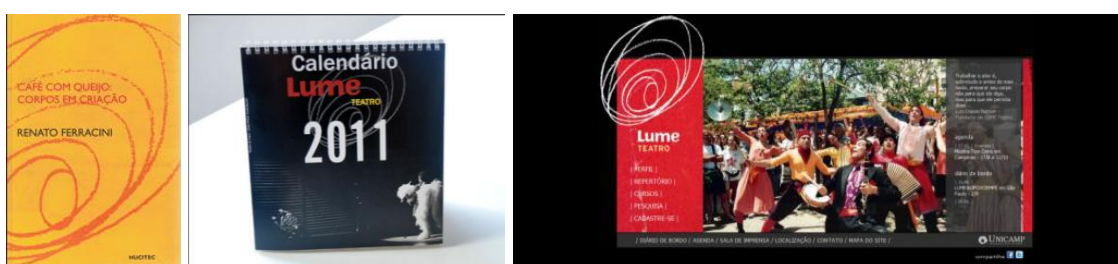
Fig.1: Livro do Lume Fig.2: Calendário (capa) do Lume Fig.3: Site do Lume (SP)

No Brasil, vários grupos artísticos desenvolvem de forma profissional ou não a divulgação dos seus trabalhos, em uma pesquisa feita na internet é possível encontrar que as mídias virtuais são as mais contempladas, desde as famosas redes sociais, até a criação de sites e blogs.