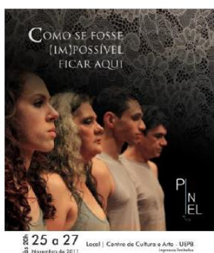
Fig. 15: Flyer

O cartaz foi criado a partir de uma das fotografias capturas por Clarissa Santos, na qual se encontram as duas personagens femininas. O cartaz seguiu a mesma estética aplicada aos flyers.