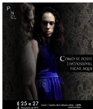
Fig. 16: Cartaz