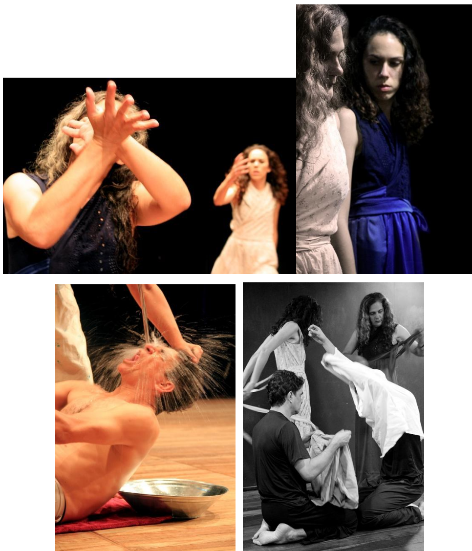
Figs. 6 - 12: