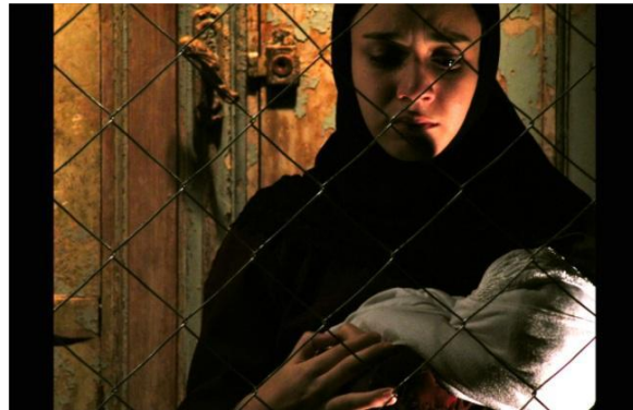
Fig.4: Amok Teatro | Espetáculo: O Dragão