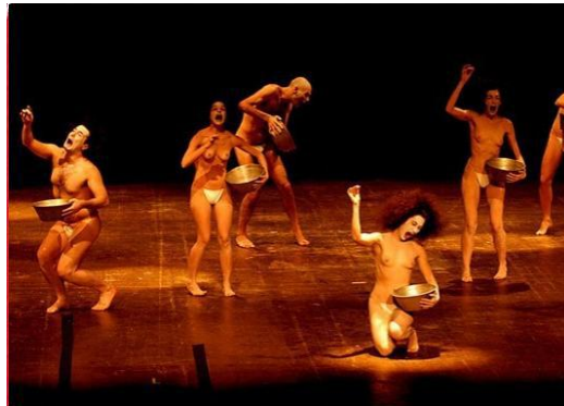
Fig.5: Lume Teatro | Espetáculo: Shi-Zen, 7 cuias

Na imagem do espetáculo O Dragão do Amok Teatro, fazemos uma leitura dos elementos que são visualizados: uma mulher usando lenço na cabeça, que nos remete às vestimentas utilizadas pelas mulheres árabes e uma tela que lembra grades e a ausência da liberdade. Na expressão da personagem nota-se tristeza e sofrimento e o fotógrafo conseguiu capturar no momento certo a dramaticidade da cena.