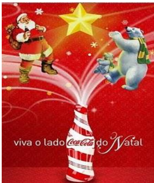
Título: Figura 1. Disponível em: < http://barretojuniovoce.blogspot.com.br/2010/10/viva-o-lado-coca-cola-do-natal.html >