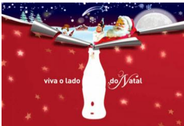
Título: Figura 5. Disponível em:

< http://www.portaldapropaganda.com/comunicacao/2006/11/0025 >