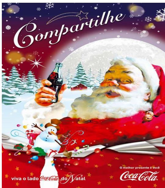
Título: Figura 4.