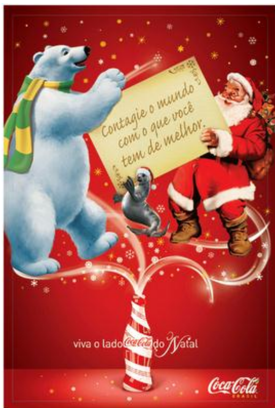
Título: Figura 1.