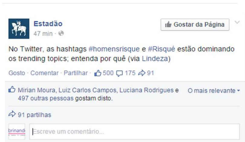
Figura 1 – Fanpage Estadão.