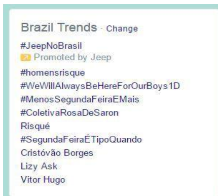
Figura 3- Trending Topics Brasil.