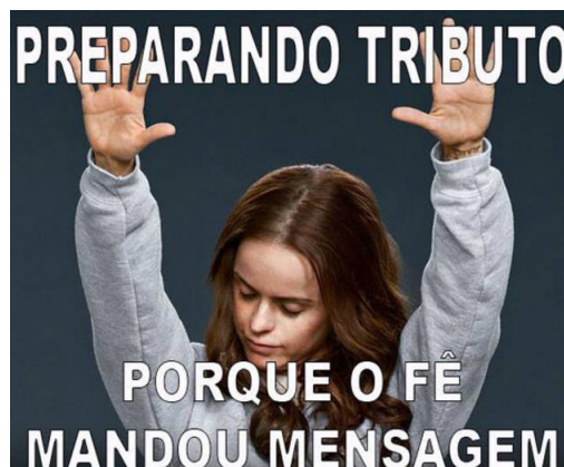
Figura 2- Meme viralizado.