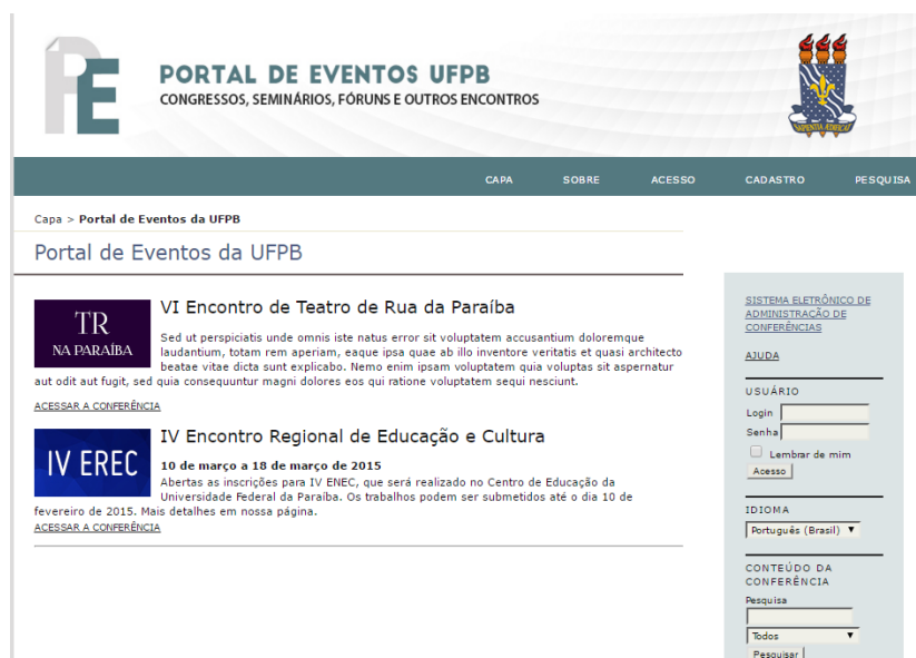
Figura 3 - Página inicial do Portal de Eventos UFPB, em construção.