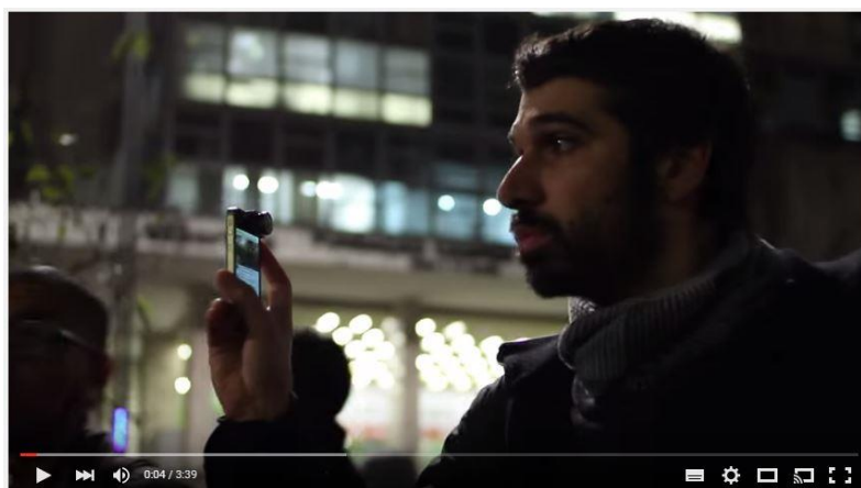
Figura 2: Membro da Mídia Ninja fazendo a cobertura do protesto

Nesse sentido, diante das múltiplas facilidades que as novas ferramentas e dispositivos tecnológicos dispõem à produção jornalística, para os grandes meios, acabam por se tornar algo como uma “faca de dois gumes”, uma vez que eles os favorecem e os prejudicam – tanto que começam a entrar em crise: