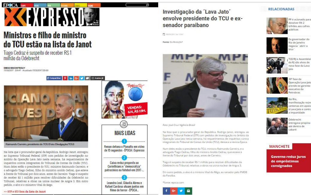
Fonte: Capturas de tela realizadas pelo autor