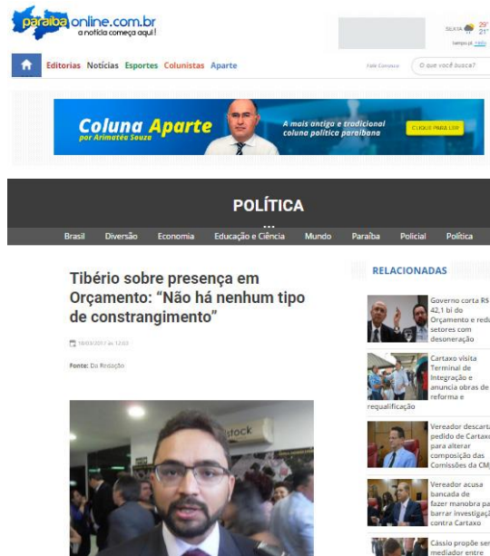
FIGURA 4: Rádio como fonte