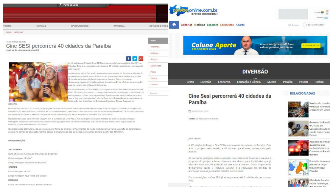
FIGURA 3: Assessoria de comunicação como fonte