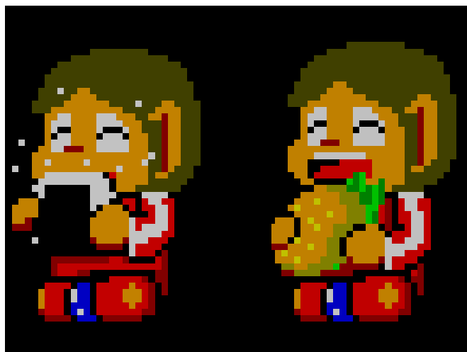
Figura 1 – Alex Kidd antes e depois da localização