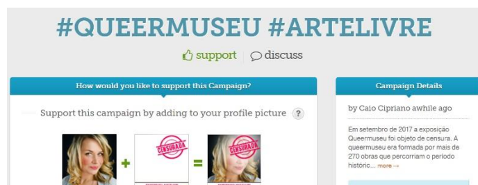
Figura 3 – Filtro contra Censura

link indicado e ao aceitar aplicar o filtro na foto de perfil, é substituída pela montagem com a foto que está atualmente no perfil e os dizeres: “Censura” “#QUEERMUSEU” “#ARTELIVRE”, postando direto no Facebook uma nova foto e gerando automaticamente um link para aqueles que estiverem conectados visualizarem para também poder utilizá-lo como filtro.