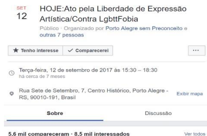
Figura 4 – Evento: Ato pela Liberdade de Expressão Artística/Contra LgbttFobia

Pensando na visibilidade nas redes sociais digitais e na mobilização social para fora delas, grupos articulados a favor da exposição de arte, criaram um evento no Facebook para agrupar aqueles que também eram favoráveis e que poderiam participar de um ato em frente ao Santander cultural, na imagem pode ser conferida a data que eles iriam se reunir, chamado “Ato pela Liberdade de Expressão Artística/Contra Lgbttfobia”. Marcando o horário e o local exato para realização do ato, conforme mostra a imagem: