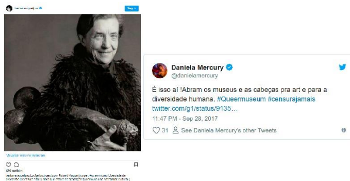
Figura 2 – Artistas contra censura

No canto direito da imagem, Daniela Mercury diz em sua página do Twitter: “É isso aí! Abram os museus e as cabeças para arte e para diversidade humana. #Queermuseum #censurajamais” e um link que dava acesso para uma notícia do portal de notícias G1 com a chamada: “Ministério Público Federal recomenda ‘imediata reabertura’ da exposição Queermuseu”. Ambas descrentes com o que estava acontecendo, indignadas e se manifestando contra a censura à exposição.