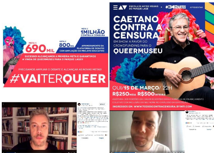
Figura 6 – Queermuseu no parque Lage