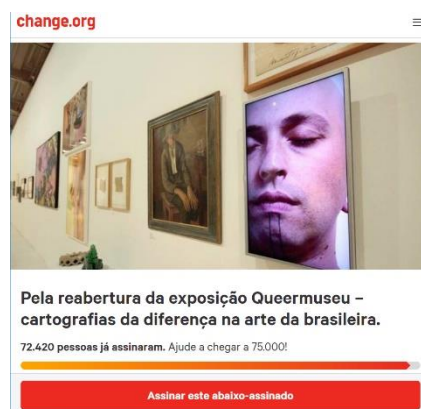
Figura 5 – Abaixo-assinado para reabertura da Queermuseu

Outra estratégia de visibilidade foi a utilização do Change.org 7 , site desenvolvido para que pessoas possam liderar mobilizações e conversar diretamente com quem decide. A organização do site fornece tutoriais de como pressionar pessoas e instituições sobre temas relevantes para a sociedade, sendo eles reafirmados pela quantidade de assinaturas a partir de um abaixo assinado que qualquer pessoa pode criar. A fim de protestar pelo encerramento, pessoas que estavam contra o encerramento criaram um abaixo-assinado pedindo a reabertura da exposição Queermuseu – cartografias da diferença na arte brasileira, o qual seria entregue para os responsáveis pela exposição no Santander Cultural.