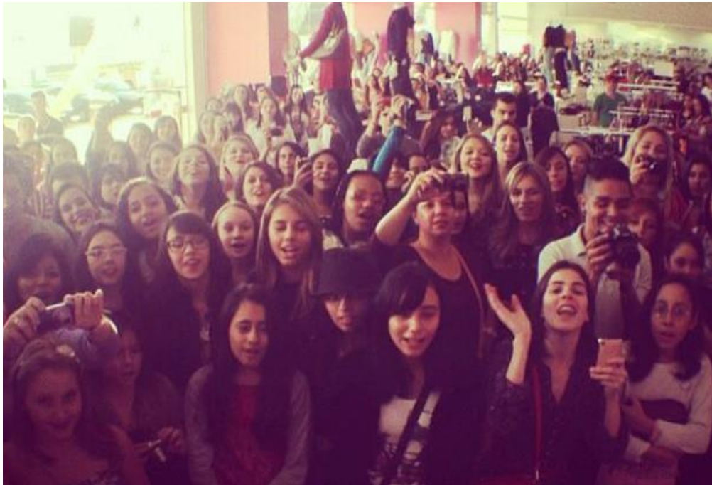
Imagem 2: “Encontrinho” realizado na cidade de Sorocaba (SP)