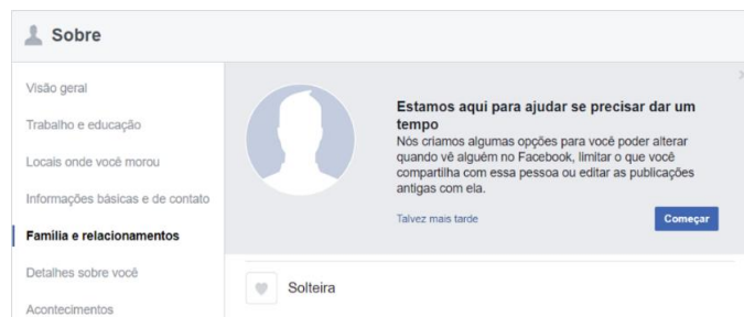
Figura 1 - Mudança no status do relacionamento