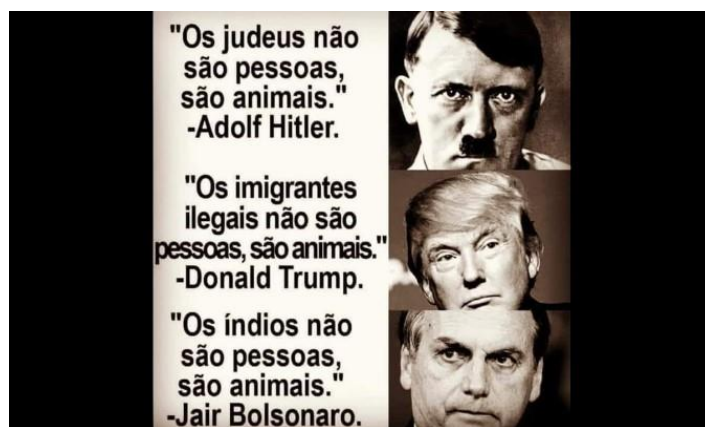
Figura 3. Imagem associa texto falso ao Presidente Bolsonaro.

aparecia com a seguinte frase ao lado: “Os judeus não são pessoas, são animais”. Em seguida, a imagem do atual Presidente americano, Donald Trump, com o texto: “Os imigrantes ilegais não são pessoas, são animais”. Por fim, o Presidente Bolsonaro com a frase: “Os índios não são pessoas, são animais”.