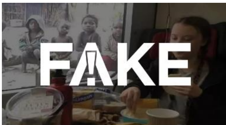
Figura 2. G1 desmente imagem falsa sobre Greta Thunberg.

Com toda a repercussão, vários veículos jornalísticos precisaram desconstruir a informação falsa disseminada pelo governo Bolsonaro. Além do G1, da Agência Aos Fatos, e da Lupa, o portal de notícias britânico Metro 15 também divulgou a informação de que a foto era falsa.