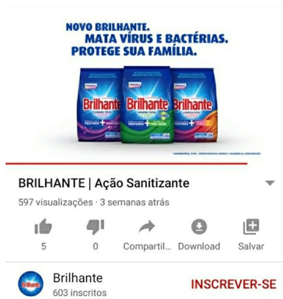
Figura 6 - Imagem final.