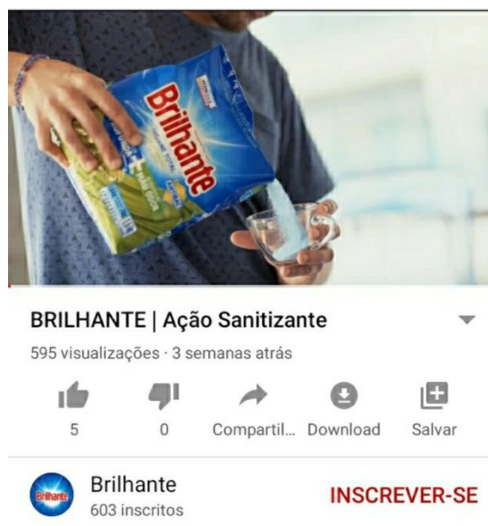
Figura 1 - Imagem Brilhante.

Fonte: imagem reprodução da tela do canal Brilhante no YouTube em 11 de abril de 2020.