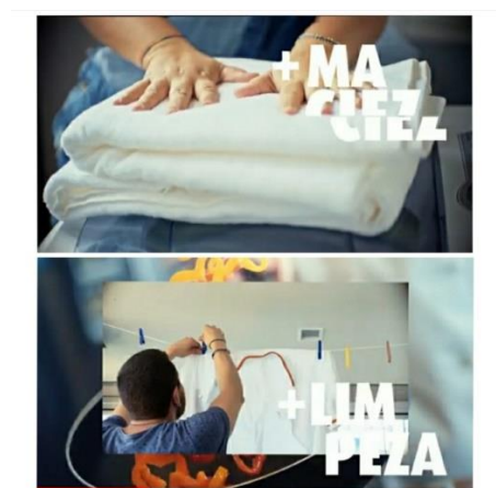
Figura 2 - Imagem frames.