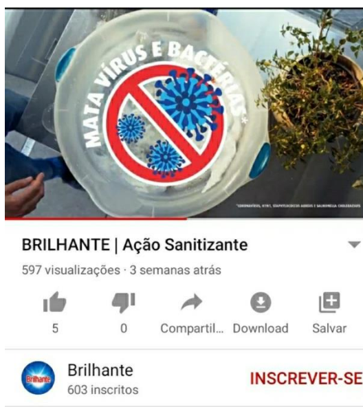
Figura 5 - Imagem vírus.