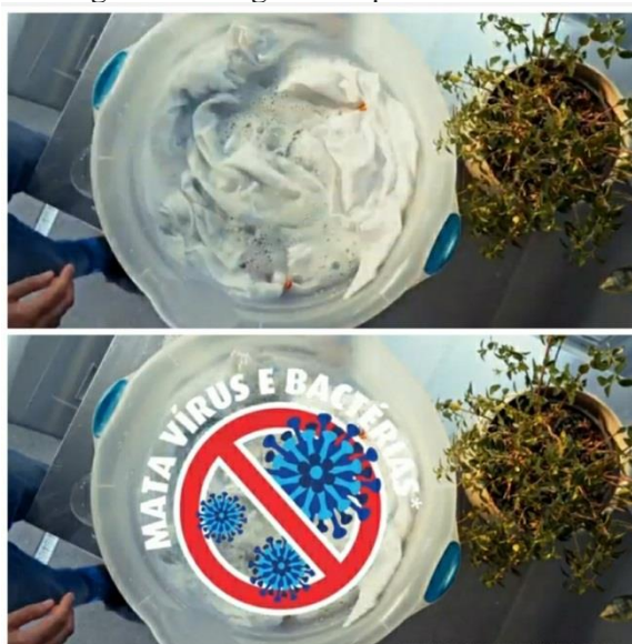
Figura 4 - Imagem comparativa.