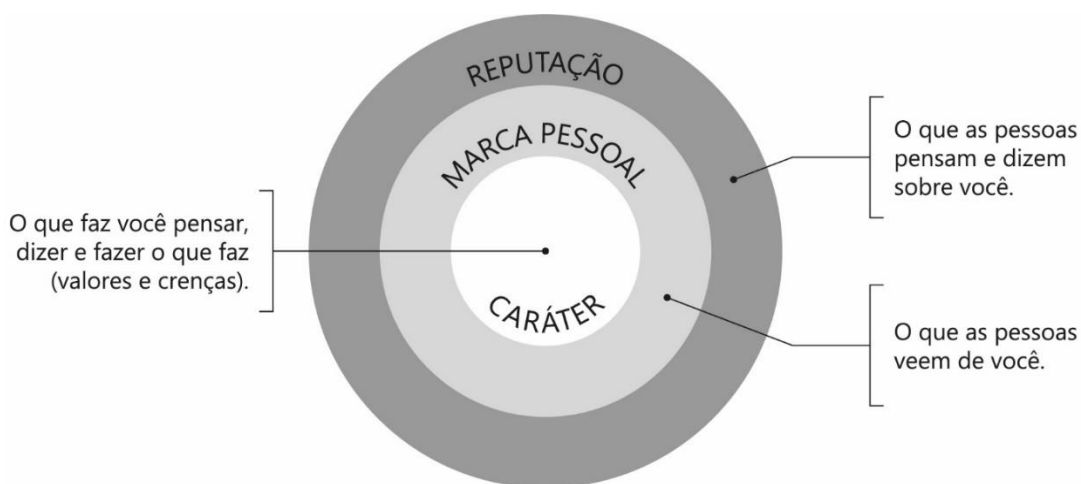
Figura 1 - Relação entre caráter, marca pessoal e reputação.

Para Brown (2010), o caráter de uma pessoa influencia diretamente sua MP e reputação, ao indicar que, ao alinhar o caráter e os valores individuais com a MP, é possível direcionar e controlar a reputação desejada. O autor propõe um diagrama concêntrico para elucidar visualmente a relação entre os termos, como ilustra a Figura 1. Nele, o caráter representa o núcleo interno do indivíduo, seus valores e crenças (personalidade interna), a marca pessoal é a expressão desse caráter ao público, e a reputação é a percepção externa construída a partir daquela. Ademais, ressalta ser simples diferenciar caráter (interno) de reputação (externo), no entanto, a distinção entre esta e a MP (expressão) é mais intrincada. A MP, descrita por ele como a “face pública” de um indivíduo, exerce um impacto direto na reputação, podendo ser parcialmente controlada através de estratégias visuais e verbais.