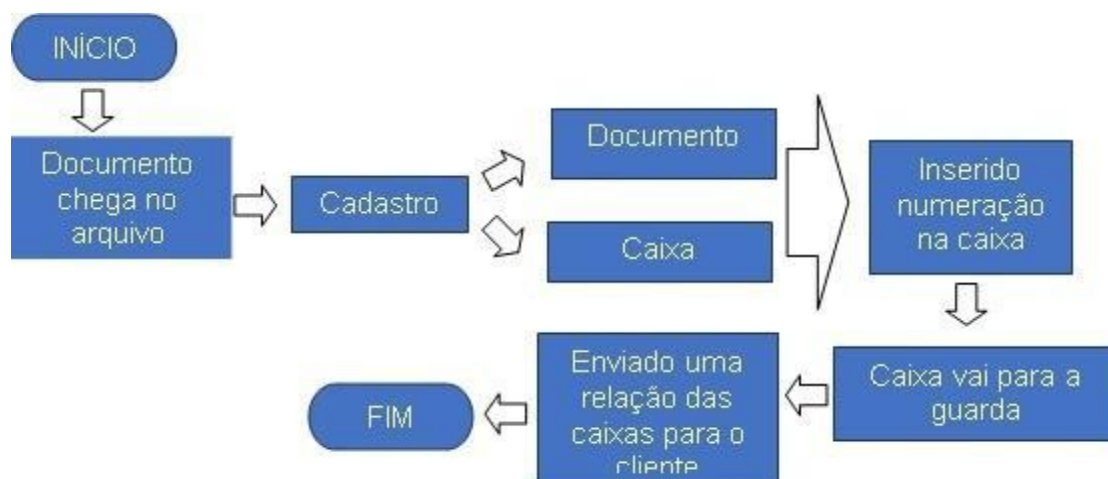
Figura 1: Fluxograma: Procedimento de guarda documental

Para se fazer a averiguação da guarda documental terceirizada é necessário saber como uma empresa terceirizada executa esse procedimento. Frente a isso, foi realizado um acompanhamento por meio de observação numa empresa terceirizada que executa esse tipo de serviço.