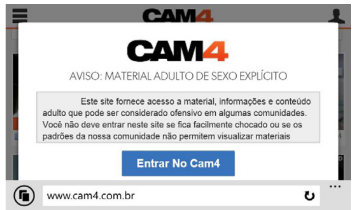
Figura 1 - Janela se abre automaticamente para avisar ao usuário sobre o conteúdo disponível no site

Logo ao acessar o Cam4 o usuário se depara com a seguinte advertência sobre o conteúdo do site: “Aviso: material adulto de sexo explícito”, conforme mostra a figura 1.