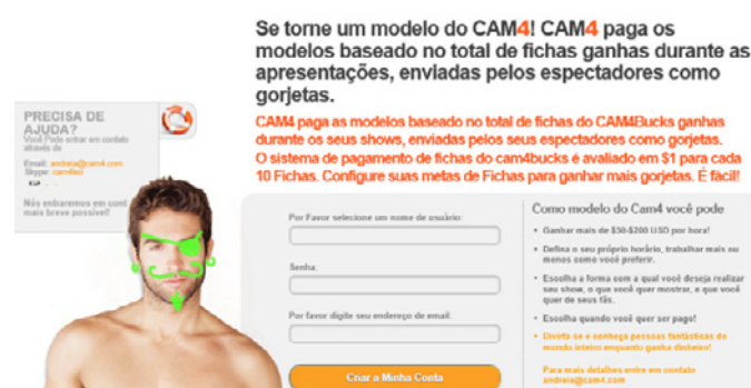
Figura 3 - No Cam4, o usuário pode virar modelo e ganhar “gorjetas” para exibir-se.

Avançando nessa perspectiva, se nessa relação virtual está estabelecida uma troca de estímulos sexuais entre sujeitos mediante pagamento, como mostra a figura 3.