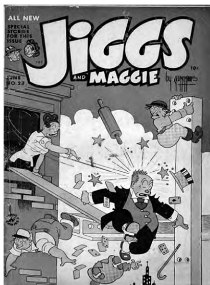
Figura 2. Capa da revista Jiggs and Maggie n.23, 1949.

Marcela Gené (2012: 206) chama a atenção para o gesto recorrente de brandir o rolo de macarrão como um símbolo da esposa tirana/megera: “Poucas coisas parecem ter identificado o poder feminino com tanta precisão quanto este utensílio, que mudou seu significado como atributo de uma dona de casa habilidosa para a arma letal de maridos indisciplinados” 8 .