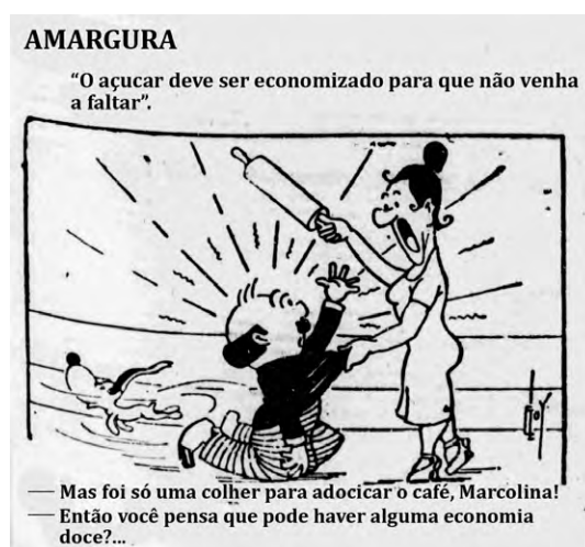
Figura 1: O Dia , 09 ago. 1942, capa.