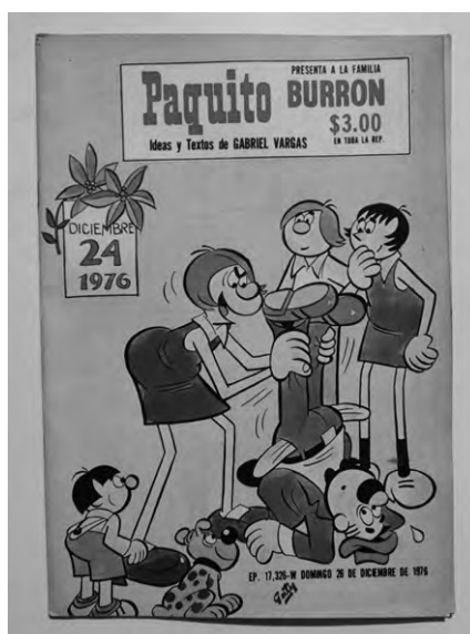
Figura 5. Paquito, 26 dez. 1976, capa