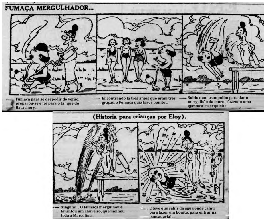
Figura 3. Eloy (Alceu Chichôrro). O Dia , 26 de abril de 1936, n.3566 (Adaptado).