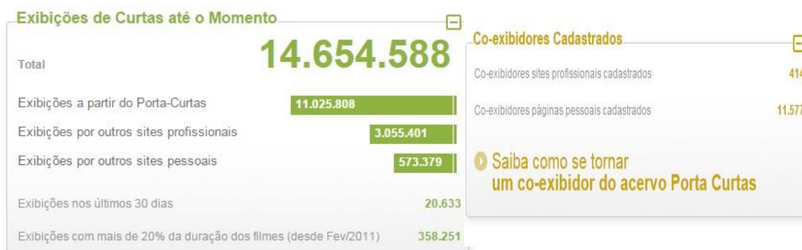
Figura 7 – Estatística com relação a exibição de curtas