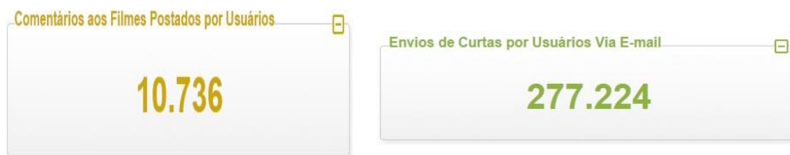
Figura 8 – Uso de ferramentas