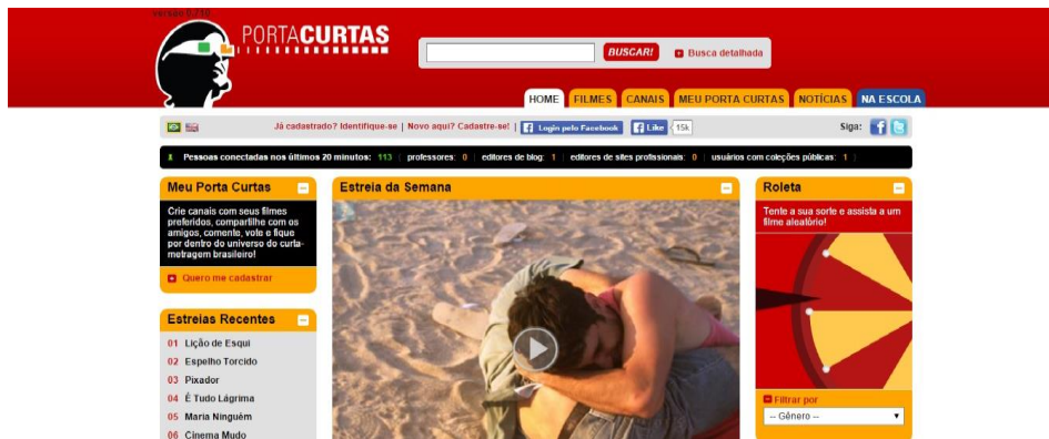
Figura 1 – Interface inicial