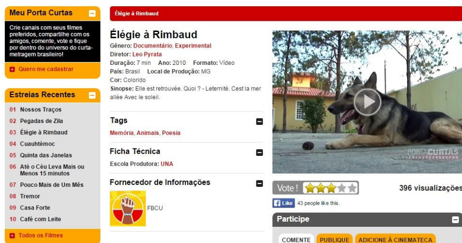
Figura 9 – Visualização da busca feita pelo usuário