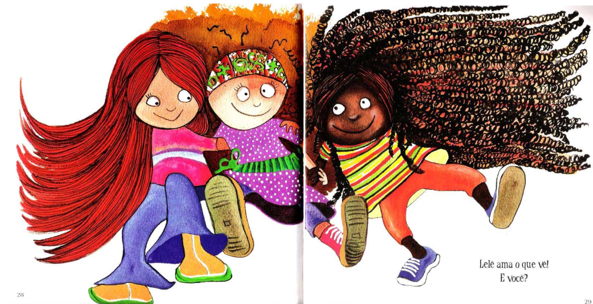
Figura 3: Ilustrações de Adriana Mendonça para: O Cabelo de Lelê, p. 28-29

leitor mirim à reflexão. Contrariando a frase que inicia a obra “Lelê não gosta do que vê”, o final aponta, após o caminho trilhado pela personagem, que “Lelê ama o que vê! E você?” (BELÉM, 2007, p. 29).