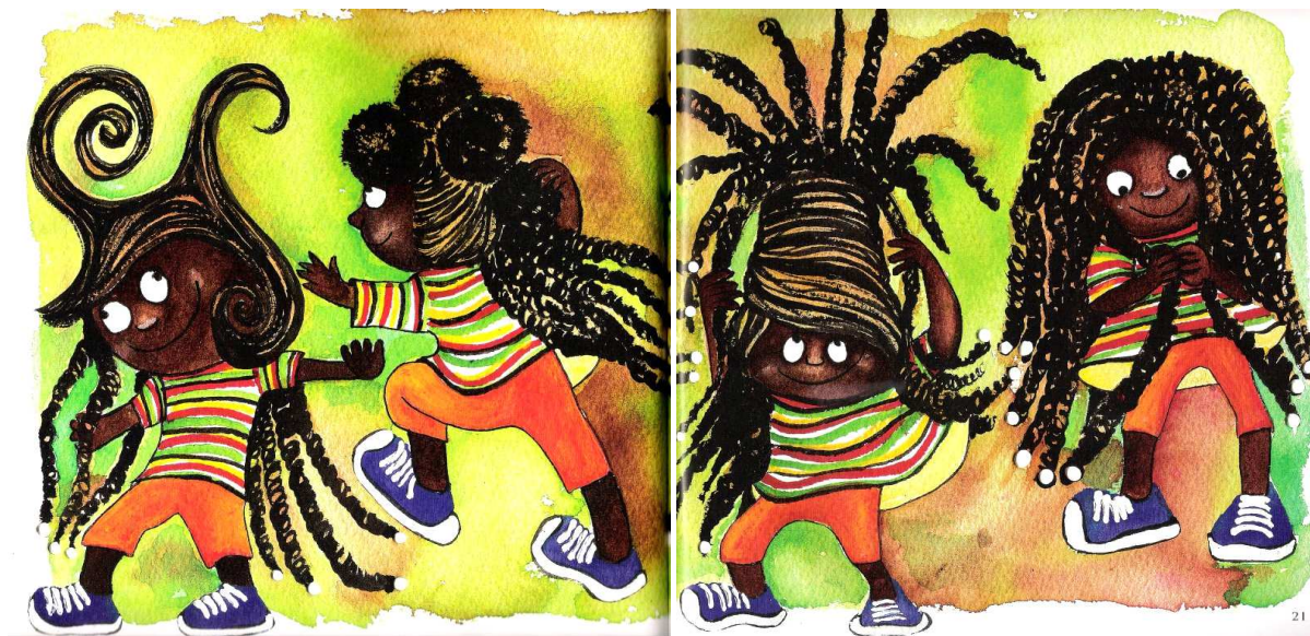
Figura 2: Ilustrações de Adriana Mendonça para: O Cabelo de Lelê, p. 20-21

proposta da autora de valorização da identidade, as cores das roupas da personagem não são aleatórias: elas trazem as cores da bandeira da África do Sul. Na camiseta estão presentes o vermelho, verde, preto, amarelo e branco. A cor azul está no tênis [Figura 2]: