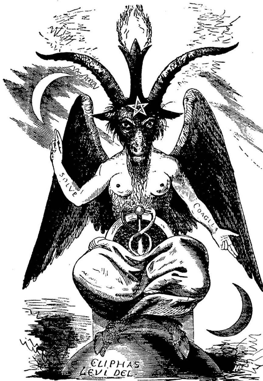
Figura 3 – Baphomet de Éliphas Lévi