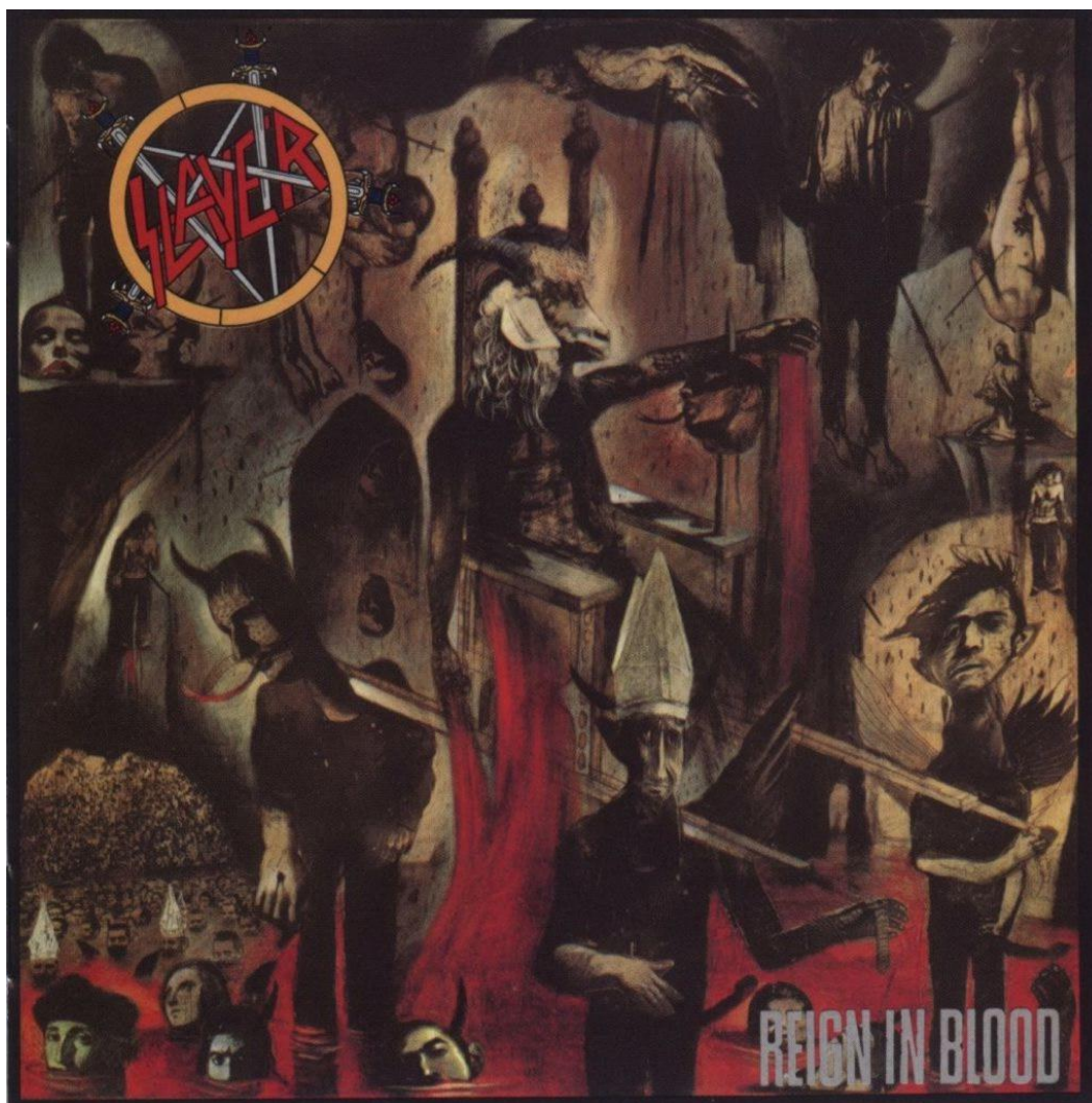
Figura 1 – capa de Reign In Blood

estrutural como associação de significante e significado, tornando explícito os conhecimentos culturais necessários para que o leitor compreenda a imagem (BAUER; GASKELL, 2002).