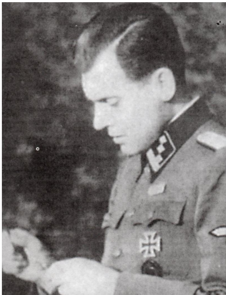
Figura 4 – Joseph Mengele no período Auschwitz

A lista de crimes contra a humanidade acumulados por Mengele nos 21 meses que esteve em Auschwitz é assombrosa. No meticuloso cumprimento dos ditames da pseudociência nazista, Mengele esterilizou prisioneiros, baleou, em rompantes de raiva, recém-chegados que desorganizavam as filas de triagem e mandou centenas de milhares de pessoas para as câmaras de gás. E Mengele desempenhava essa barbárie de forma fria e cínica, sempre imaculável na sua apresentação, assoviando árias de Verdi e Puccini. A sua polidez, sorriso trocista e o modo suave lhe valeram o epíteto de “Anjo da Morte”, que com simples aceno matou 400 mil pessoas, entre mães, bebês, crianças e idosos. Os crematórios de Auschwitz ardiam dia e noite com os restos mortais das “vidas indignas de vida”, vítimas da higiene racial alemã (POSNER; WARE, 2006).