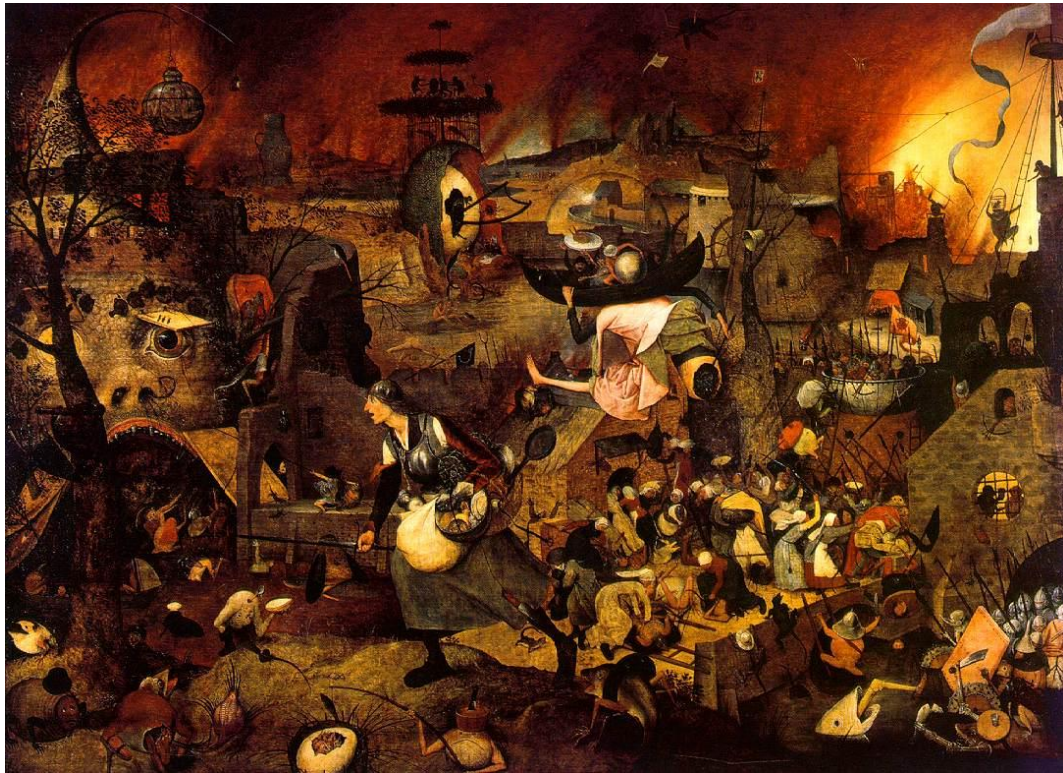
Figura 8 – Dulle Griet (c. 1562) de Bruegel

assegurar a segurança de seus bens materiais – carregados num saco – mas na verdade corre diretamente para a temerosa “Boca do Inferno”, à extrema esquerda do quadro. Margarida e os coadjuvantes humanos do quadro condizem com a imagem brueleguiana do homem: uma criatura imperfeita, mostrada sem compaixão e sem a glorificação antropocêntrica do Renascentismo. São como os camponeses de Bruegel: homens e mulheres que são parte da natureza, próximos ao mundo dos instintos (HAGEN; HAGEN, 2004).