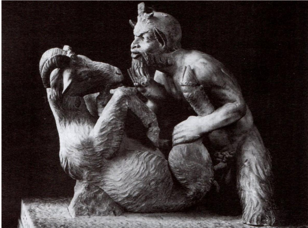
Figura 2 – Estátua de Pã pertencente ao Museu Nazionale (Nápoles)