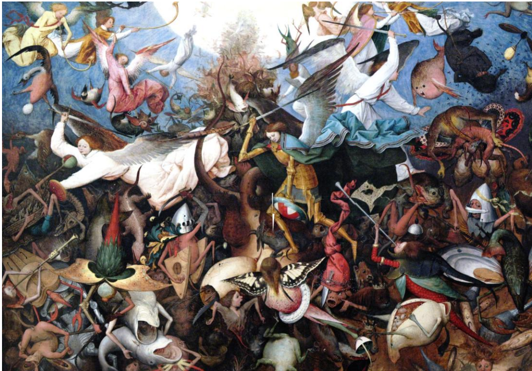
Figura 7 – A Queda dos Anjos Rebeldes (1562) de Bruegel