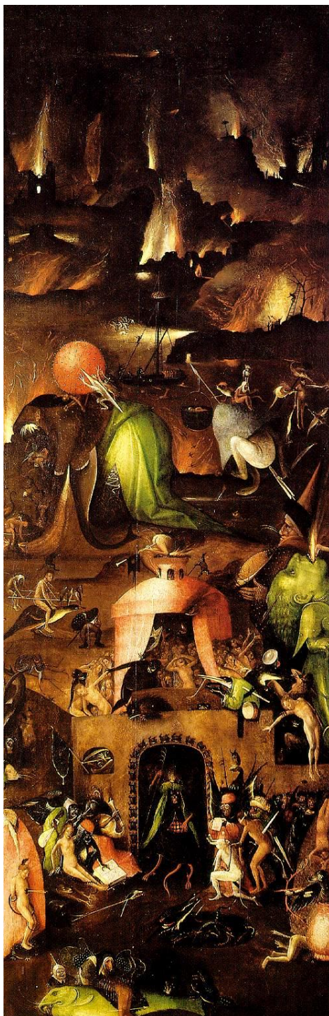
Figura 5 – “O Inferno” (c. 1482) de Bosch

da Idade Média, os cenários oníricos dessas obras e suas figuras misteriosas fizeram Bosch ser considerado um surrealista do século XV (BOSING, 1991).