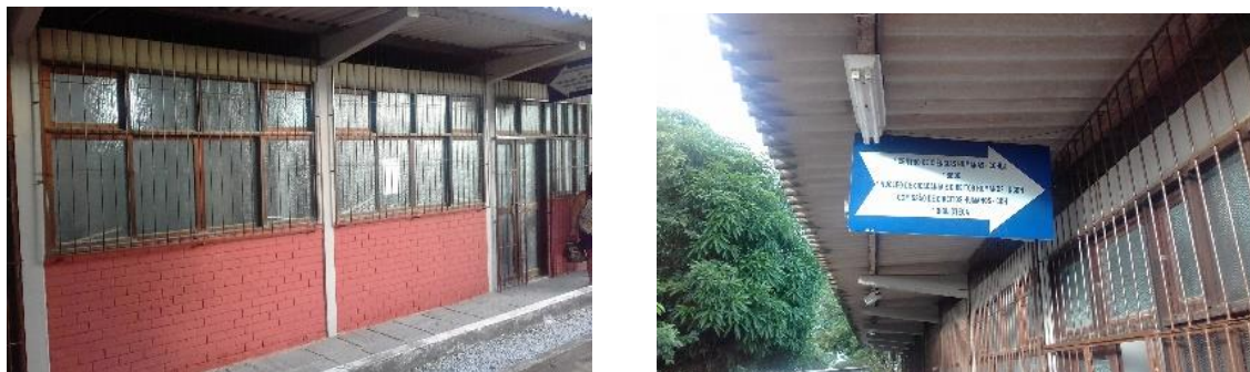
Figura 1 – Fachada do Núcleo de Cidadania e Direitos Humanos