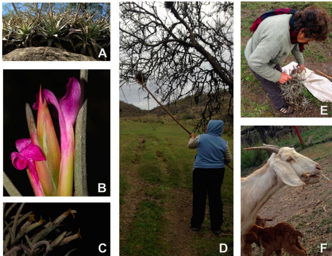
Figura 2. Bromelias forrajeras en las Sierras de Ancasti, Catamarca, Argentina. A: chaguares ( Deuterocohnia longipetala ). B: azahares ( Tillandsia argentina ). C: claveles del aire ( Tillandsia capillaris ). D: Recolección de "azahar" ( Tillandsia ixiooides ). E: Deshoje y limpieza de los "azahares". F: Ganado caprino consumiendo Tillandsia ixiooides .

Al igual que lo registrado por Astegiano et al. (2007) para la provincia de Córdoba (Argentina), en Ancasti existen algunas percepciones negativas sobre las especies denominadas claveles del aire ( Tillandsia capillaris y T. minutiflora ), por ser consideradas como plantas parásitas, plagas o pestes de los árboles. Como expresan los pobladores: "Los claveles del aire son parásitos, no precisan de nada, donde se prenden se hacen vida... pero no deben tener ninguna maldad porque los animales lo comen" (hombre, 52 años) y "los claveles del aire son una plaga y no sirven para nada" (mujer, 65 años). Sin embargo, en la comunidad no se percibe una preocupación por la proliferación de estas especies epifitas o del posible perjuicio que podrían llegar a generar en la vegetación que las hospeda, aunque algunos trabajos presentan evidencias sobre los posibles efectos negativos de poblaciones de especies del género Tillandsia en la vegetación (Montaña et al. 1997; Benzing 2004; Astegiano et al. 2007).