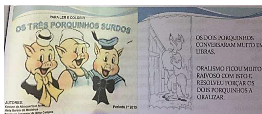
Figura 5: Adaptação de Os três porquinhos