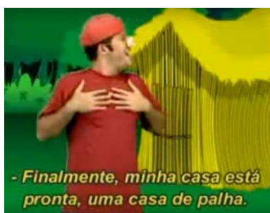
Figura 4: Os três porquinhos (obra traduzida)

Na disciplina foi apresentada a obra original traduzida para a Libras (Figura 4) 12 e partindo do conhecimento da obra original, foi proposto aos alunos que produzissem adaptações que recontassem esta história no contexto da vivência de mundo da comunidade surda.