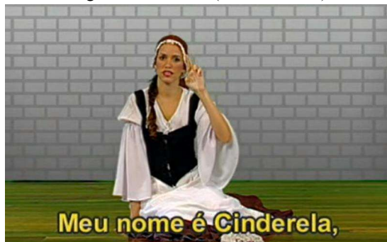
Figura 2: Cinderela (obra traduzida)

exemplos de contos, lendas e fábulas, no site youtube.com existe diversos vídeos de traduções do gênero poético.