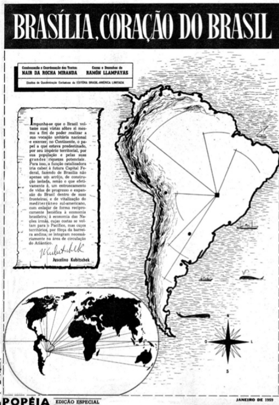
Figura 3 – Página 3 da HQ Epopéia – Brasília, coração do Brasil , Rio de Janeiro, EBAL, 1959.