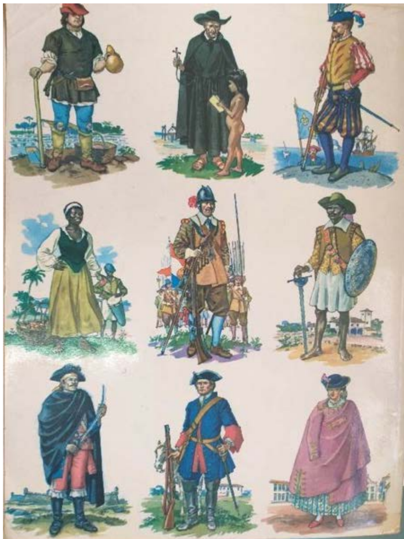
Figura 5 – Contracapa da 1ª edição da revista História do Brasil em Quadrinhos

(Figura 5), temos um plano branco, neutro, no qual temos nove personagens da história brasileira dispostos, retratados em cores e com cenários que denotam a origem dos mesmos.