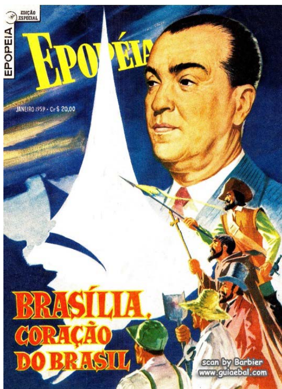
Figura 1. Capa da HQ Epopéia – Brasília, coração do Brasil , Rio de Janeiro, EBAL, 1959. Fonte: Guia Ebal [sítio: http://guiabal.com/ ]. Visitado em 30 jun. 2019

No final da década de 1950, houve uma fervorosa atividade da Editora Brasil América no que se refere à questão nacional. Como já dito, os quadrinhos que foram utilizados no livro didático de Hermógenes estavam contidos em edições de alguns exemplares da série Epopéia . Dentre elas temos Brasília, coração do Brasil , publicada em 1959 (Figura 1).