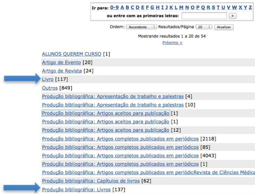
FIGURA 3 – Navegação por tipo de documento no repositório da UFBA Navegando por Tipo de documento