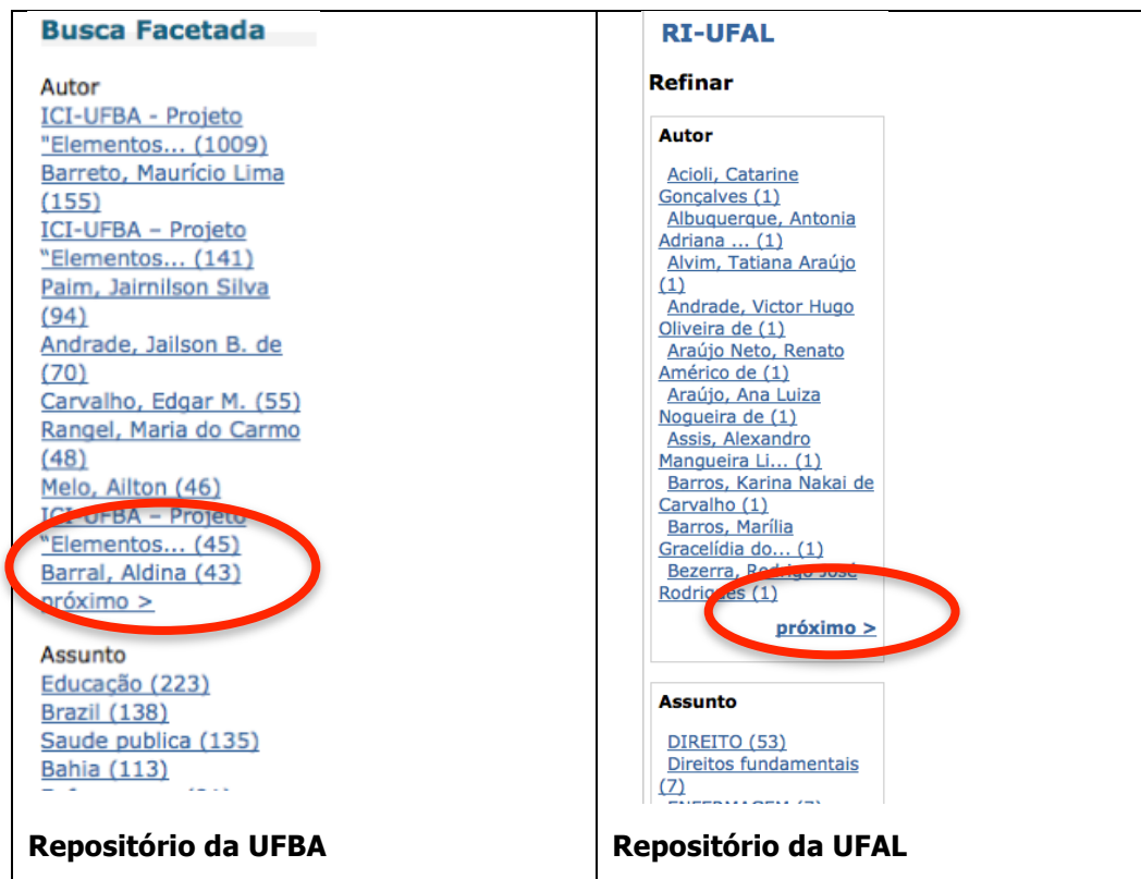
FIGURA 5 – Menu da direita dos repositórios da UFBA e da UFAL

(vide FIGURA 5 – lado esquerdo). Porém, ela é bem confusa, inclusive seus botões de navegação ficam ocultos no meio do texto, não deixando claro como navegar entre as opções. No repositório da UFAL há o mesmo tipo de informações a direita, mas chamada de REFINAR (vide FIGURA 5 – lado direito), os botões estão um pouco mais destacados, ainda assim a navegação pelas opções não é clara para os usuários.