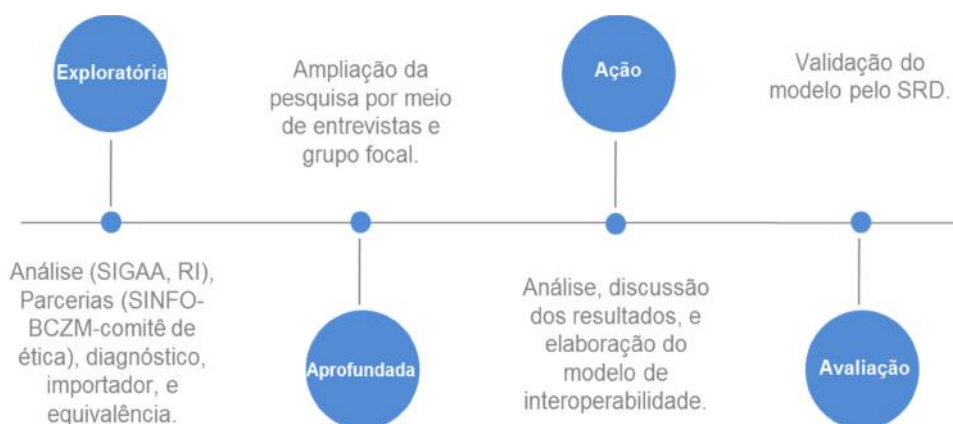
Figura 1 – Fluxo da pesquisa