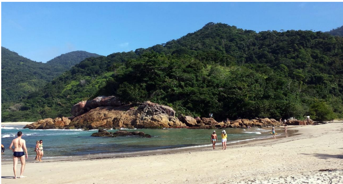
Figura 1 - Entrada da trilha, Praia do Meio, Trindade, Paraty.

O texto se apoia em pesquisas do Laboratório de Geomorfologia Ambiental e Degradação dos Solos (LAGESOLOS) na área iniciadas em 2015 e propõe que, a partir da aplicação do conceito de lugar, de jardim histórico como formulado na Carta de Florença (1981), se alcance uma reinterpretação da trilha como sendo um espaço envolto por coleções naturais e sensoriais, como instalação artística. Esta interpretação da paisagem tem o objetivo de ampliar o seu significado para o visitante, indo além da função de suporte à circulação de pessoas e se constituindo como uma experiência sensorial junto à Natureza.