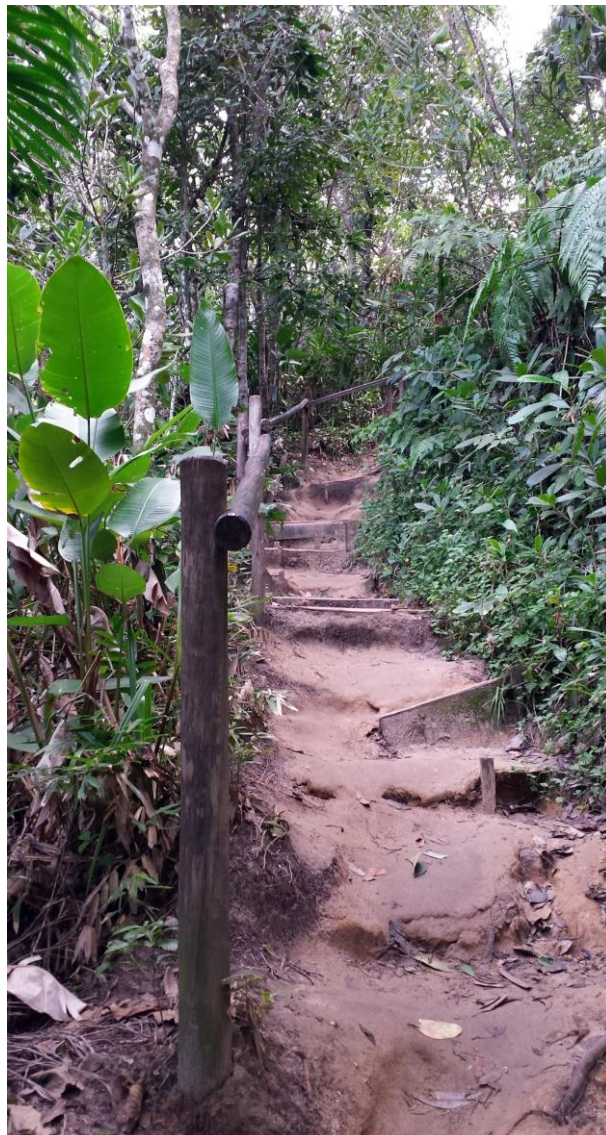
Figura 2 - Detalhe trilha em Trindade.

A proposta é a de se assegurar a conservação desses ambientes, mas de modo que sejam mantidos o cenário paisagístico e a ambiência perceptível nesses lugares: Embora ignorados pela legislação de proteção ambiental, porque vistos apenas como vias de acesso, esses caminhos guardam interesse singular tanto científico quanto estético, o que justifica o seu estudo e sua caracterização como instalações próprias da arte, do ponto de vista do visitante ao caminhar por aquelas trilhas.