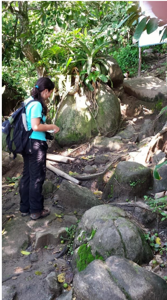
Figura 7 - Detalhe erosão ao longo da trilha (Trindade, Paraty, 2015).