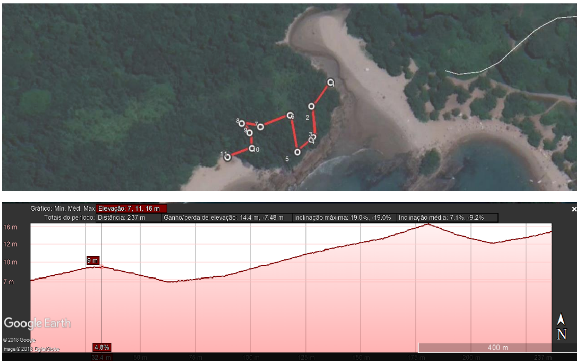
Figuras 4 e 5: Greide e perfil da trilha (LAGESOLOS, outubro 2018; fonte imagem satélite: Google Earth, 2018).

Quando se trata do valor de uso imaterial (PULS, 2006) no ambiente e da paisagem (GUERRA; LOUREIRO, 2022), a interpretação do lugar como um símbolo, é uma proposta de reflexão, de uma leitura da paisagem naquilo que tem de significado para o visitante/pesquisador no que tange à percepção estética e sensorial do lugar, questão que a pergunta da turista concluiu por destacar.