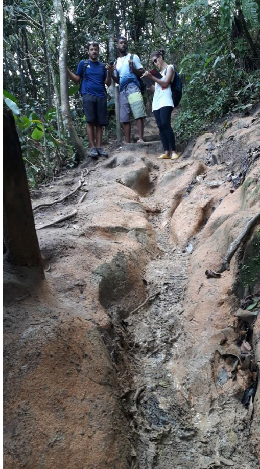
Figura 6 - Detalhe de ravinas decorrentes da convergência de fluxo na trilha (Trindade, Paraty, 2018).

A acessibilidade no local é precária e necessita de um projeto para a sua implantação, mas sem alterar o cenário, a percepção da Natureza e o conteúdo singular oferecido por esses lugares especiais.