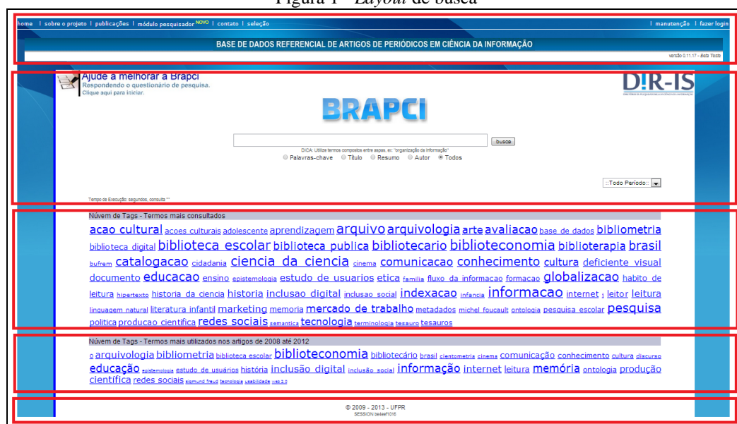
Figura 1 - Layout de busca

Nas Figuras 2 e 3 são mostradas, respectivamente, as perspectivas de layout de busca e de apresentação de resultados na Brapci. As cinco partes de cada perspectiva estão destacadas por um retângulo vermelho.