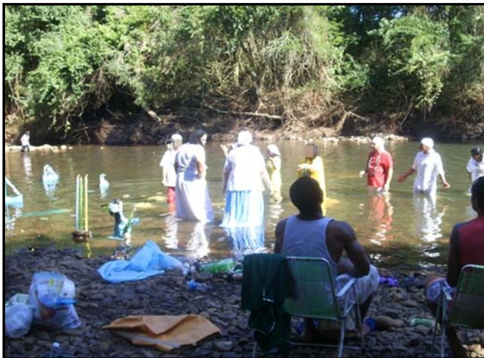
Figura 1: Cerimônia umbandista as margens do Rio Ibicuí em Santa Maria/RS/Brasil.