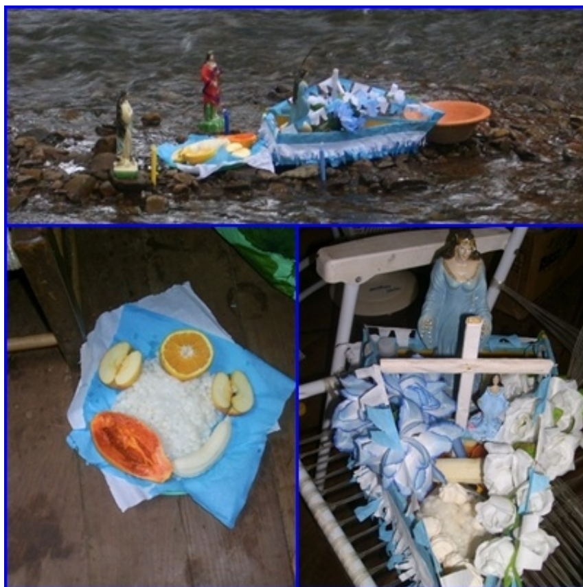
Figura 2: Oferendas para lemanjá.