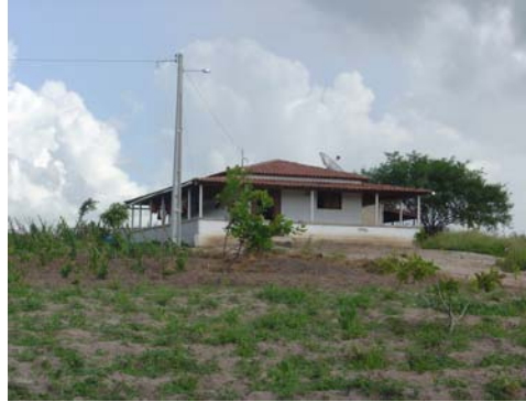
Foto3: Residência de um dos assentados

A melhora das condições de vida e trabalho dos assentados é visível e pode ser confirmada através do depoimento do Sr. João Muniz da Cruz Filho: