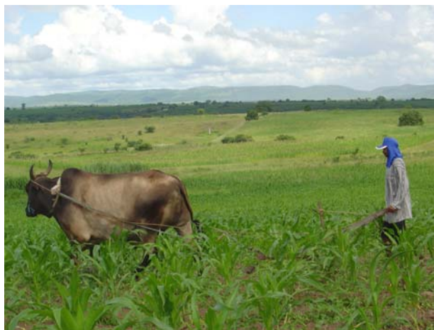
Foto1: Trabalhador contratado para auxiliar no cultivo em uma das parcelas no assentamento.

Os assentados produzem milho, feijão, mandioca, macaxeira, amendoim, batata doce, fava e possuem criações de bovino, caprino e aves que auxiliam na manutenção das famílias. A maior parte da produção está destinada ao consumo familiar, porém os assentados comercializam seus produtos no município de Itabaiana-PB com atravessadores. Segundo relato dos assentados a produção do assentamento é tão grande que eles fornecem por ano uma média de 30 mil quilos de feijão verde, mais de 60 mil quilos de mandioca, comercializando ainda milho, amendoim entre outros produtos. A renda das famílias é complementada com o programa bolsa família. Além da renda gerada a partir da comercialização da produção, os assentados estão gerando empregos já que não dão conta da produção tornando-se necessária a contratação de trabalhadores alugados de fora do assentamento para auxiliar no cultivo.