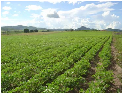
Foto2: Plantação de amendoim de uma família