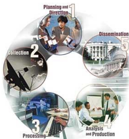
Figura 1 – Intelligence Cycle