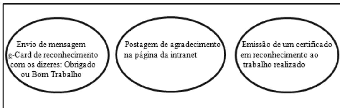
Figura 2 – Formas de reconhecimento simbólico