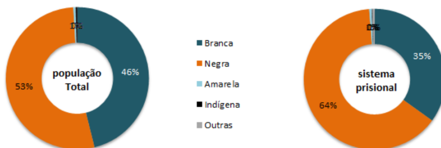
Figura 2 – Raça, cor ou etnia das pessoas privadas de liberdade e da população total.

Isso se reflete nas estatísticas estatais sobre a população carcerária. A maior parte dos presos são homens, jovens, pobres e de baixa escolaridade. Além disso, registrou-se que a etnia de 64% dos detentos é negra (DEPEN, 2017, p. 32). Isso é consequência do excesso da política criminal brasileira, que atua como uma verdadeira forma de controle social.