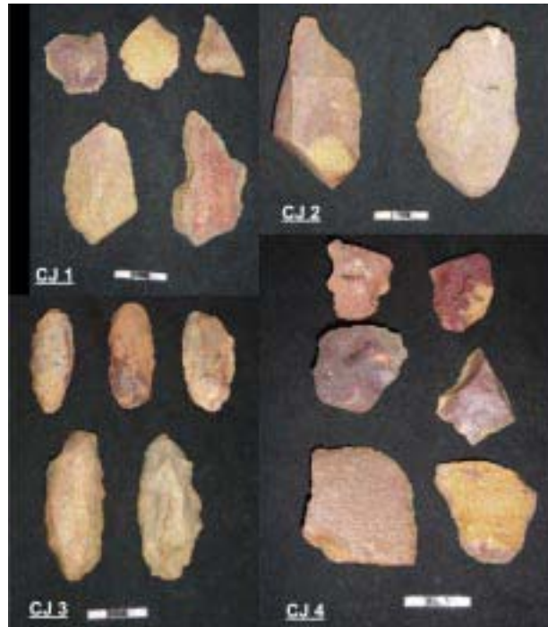
Fig. 06 - Foto dos conjuntos de artefatos do sítio Lajeado 1 - Cj 1: artefatos informais da área 2; Cj 2: artefatos formais não padronizados da área 1; Cj 3: artefatos formais padronizados sobre lasca da área 1; Cj 4: artefatos informais da área 1.