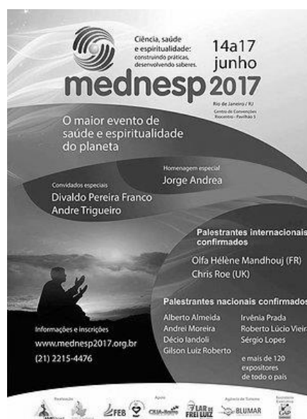
Figura 4: Cartaz sobre evento promovido pela AME.

A AME tornou-se uma associação profissional de referência no movimento espírita e fora dele. Ao agregar representantes de uma profissão de prestígio, estabelece um lugar de fala autorizado, possibilitado ainda pelo crescente interesse humano em buscar terapias alternativas, aquelas que se diferenciam das abordagens materialistas alopatas.