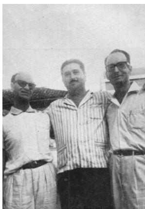
Figura 4: Foto de Chico Xavier (à direita) com os médiuns José Arigó e Waldo Vieira

Essas manifestações da mediunidade de cura não são bem vistas por todos os espíritas. Embora Chico Xavier tenha se deixado fotografar com José Arigó em 1964, e incentivado João de Deus a continuar com seu trabalho, mediante um bilhete escrito em 1993 4 , ele mesmo nunca se submeteu a uma intervenção espiritual com corte, apenas se submetia aos passes.