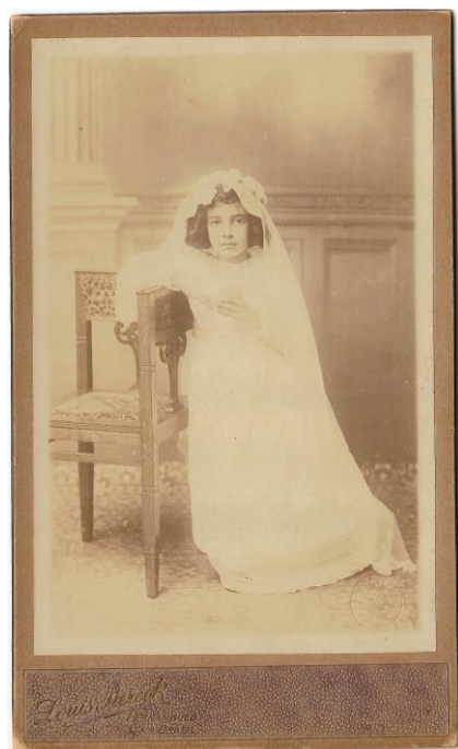
Fotografia 1: Adolescente não identificada