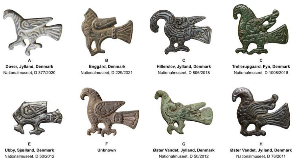
Figura 8: Exemplos de broches em forma de ave (talvez uma águia), datados do século X, achados na Dinamarca.

A duas aves vistas nas pedras U 448 e Gs 2 apresentam caudas bem amplas, asas mais curtas e sobretudo, ambos possuem cristas, mesmo que essas sejam apresentadas de forma diferente. Já a ave da U 629 possui cauda em forma de leque, mas tem o bico curvo e não possui crista. Diante disso consideramos que possa ser uma águia, como proposto por Wessén e Jansson (1949, p. 68), Oliveira (2016, p. 63) e Langer, Oliveira e Furlan (2018, p. 146). A própria Gräslund (2021, p. 187) também comenta que a representação dessa ave apareça de forma dúbia, gerando dúvida se seria uma águia ou um galo. Para endossar o comentário de Gräslund reproduzimos a figura 8.