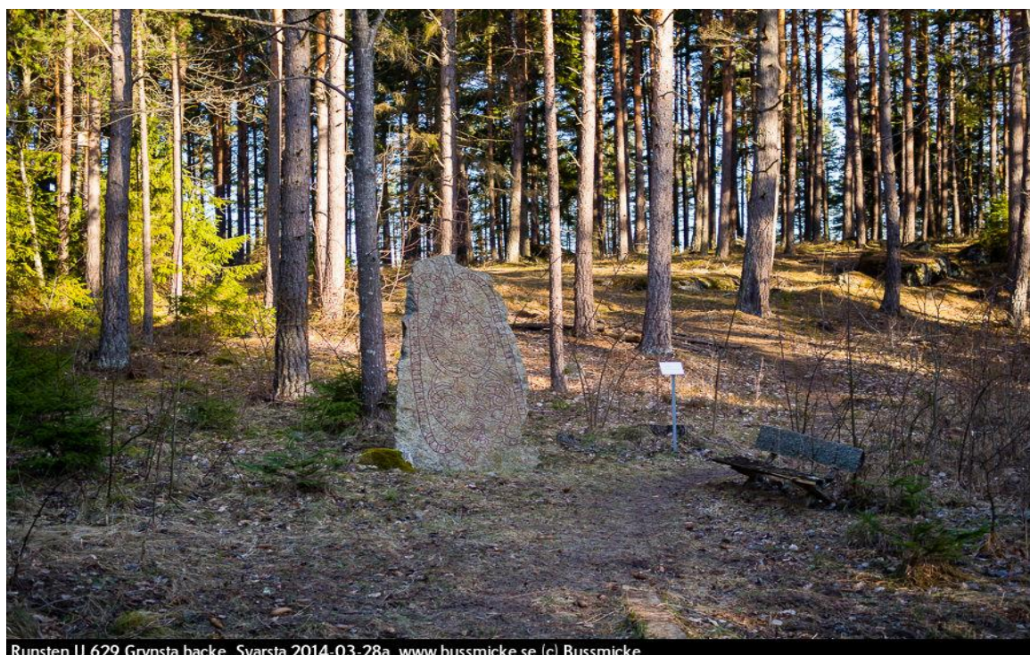
Figura 2: A pedra U 629 em fotografia do ano de 2014. Na imagem podemos ver que a pedra fica situada num bosque, havendo uma placa de identificação e um banco na proximidade.

No caso da U 629 suas dimensões são de 2,25 metros de altura e 1,15 metros de largura. Seu peso é desconhecido. Sua coloração atual é cinza da cor do granito. As cores utilizadas originalmente para destacar as runas e pintar as imagens não são mais visíveis. Inclusive se desconhece exatamente quais seriam essas cores. (MARJOLEIN, 2013, p. 332). Fotografias de 2008 apresentam o monumento contendo runas e figuras realçadas com tinta vermelha, além de que a pedra estava com manchas de desgaste e sujeira, como também já exibia algumas bordas quebradas. Já em fotografias de 2014, a U 629 aparece em melhor estado de conservação, já livre das manchas (Figura 2).