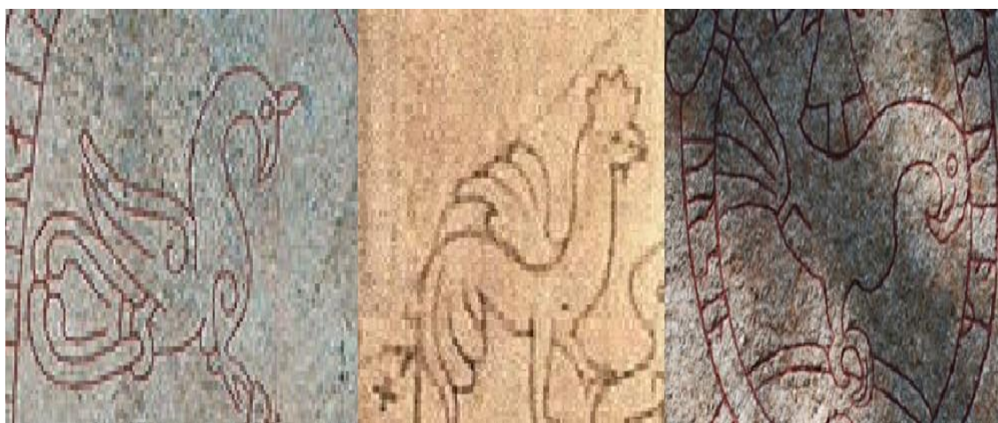
Figura 7: Na primeira imagem à esquerda temos um galo como encontrado na pedra U 448, ao lado encontra-se o esboço do galo encontrado na pedra Gs 2. E na direita a ave da U 629.

Stern Marjolein (2013, p. 156) salienta que a maioria das aves representadas nas pedras rúnicas seriam corvos ou águias, embora note-se a presença de outras aves que são consideradas como sendo cisnes, corujas e galos. Em geral a águia é retratada tendo o bico levemente encurvado em formato de gancho, por sua vez, os galos são representados com caudas mais amplas e possuindo crista. Vejamos uma breve comparação com imagens de galos e a ave da U 629 (Figura 6).