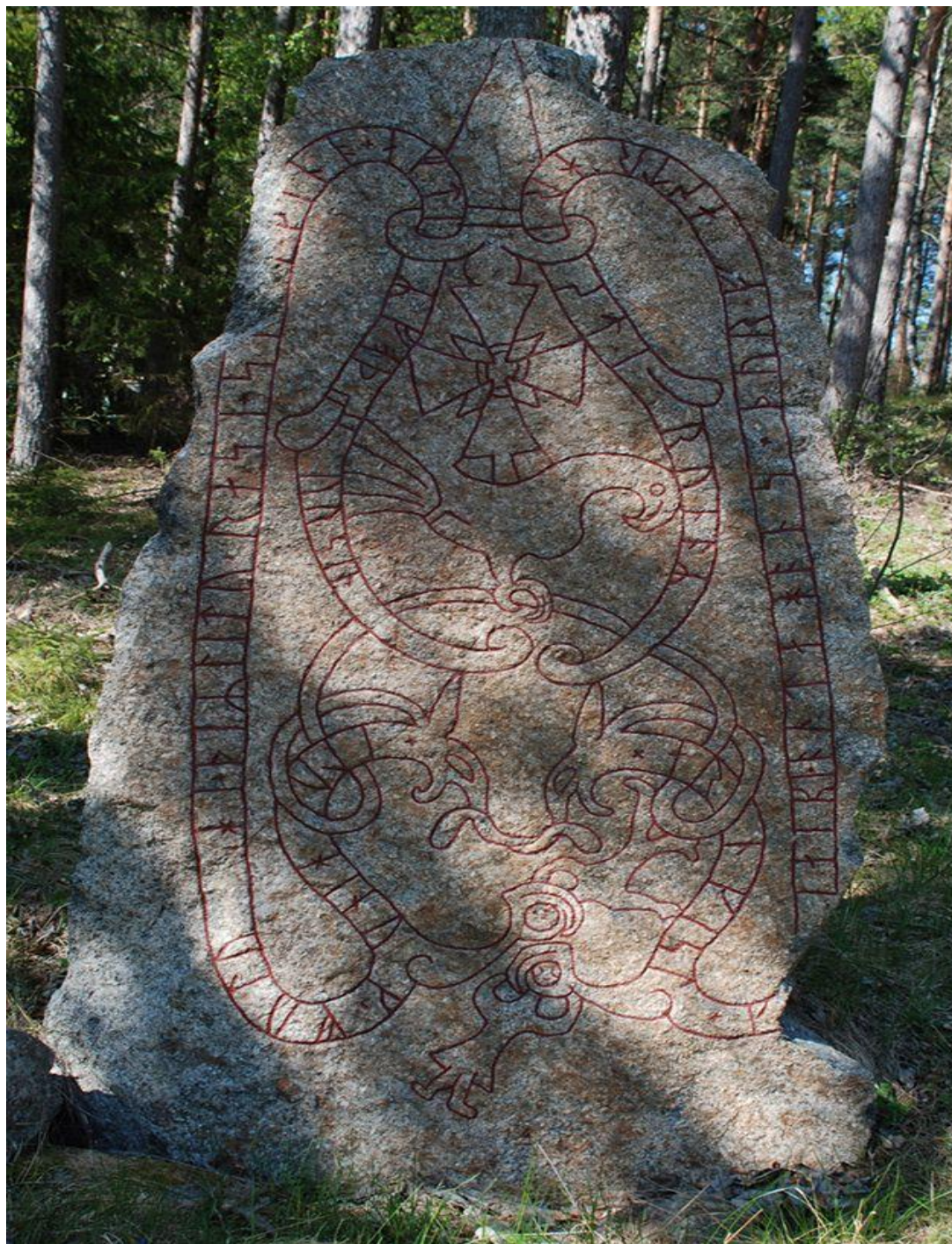
Figura 3: A pedra rúnica U 629.