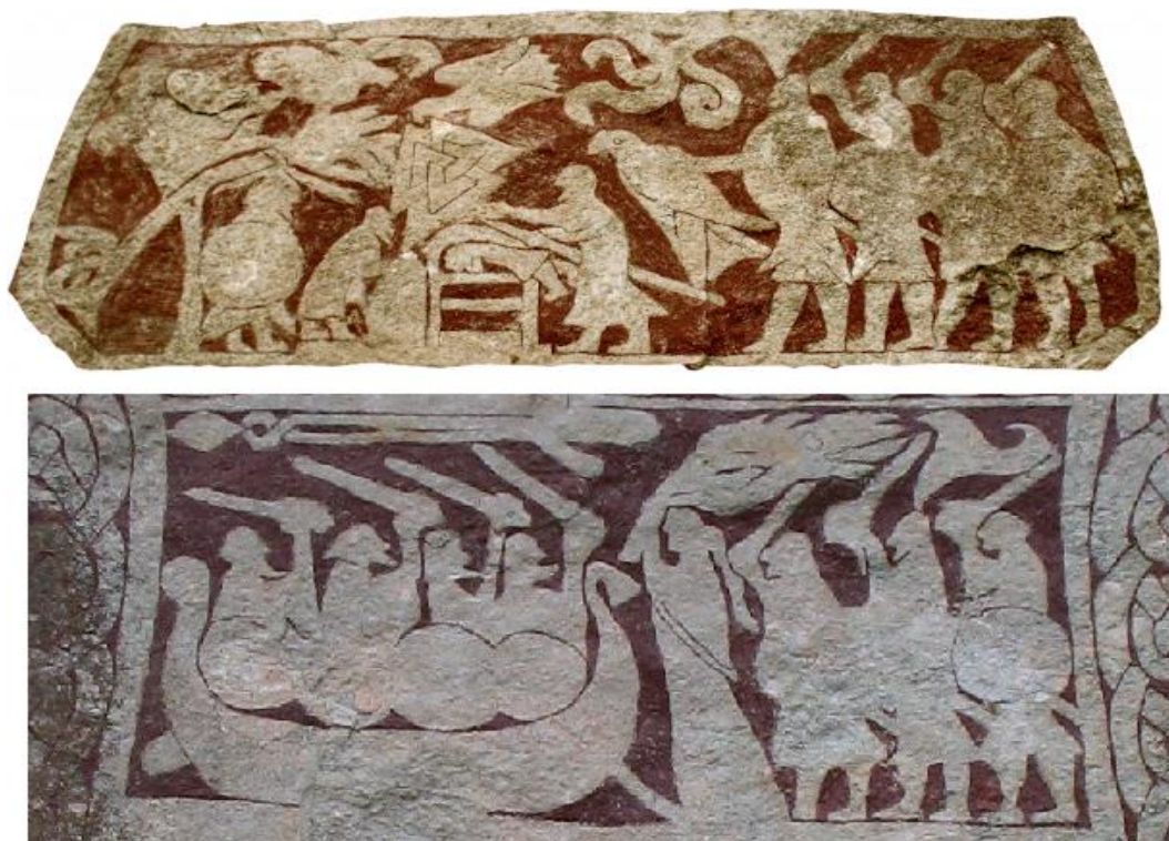
Figura 4: Detalhe de duas cenas da pedra gravada de Stora Hammars I.

imagem, diferente do vestido longo que chega até mesmo em alguns casos a arrastar a bainha no chão. Na figura vista na U 629 aparenta que o traje se encontra na altura das panturrilhas. No intuito de esclarecer esse pequeno detalhe que pode fazer a diferença em nossa interpretação, recorreremos ao exemplo da pedra gravada de Stora Hammars I (sécs. VIII-IX), que é bastante conhecida dentro do grupo destes tipos de monumentos (ver figura 4).