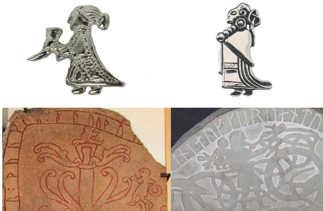
Figura 5: Cima: dois pingentes femininos associados a valquírias, datados do século IX-X. Abaixo à esquerda, a Gs 2 e à direita a G 114, ambos monumentos datados do século XI. Imagem produzida pelo autor com base no banco de imagens da Wikipédia Commons.

monumentos eles apresentam figuras humanas as quais estão aparentemente nuas ou quando aparecem vestidas, trajam um tipo de túnica que fica na altura do joelho. Veste essa que lembra a encontrada na U 629. (ver figura 5).