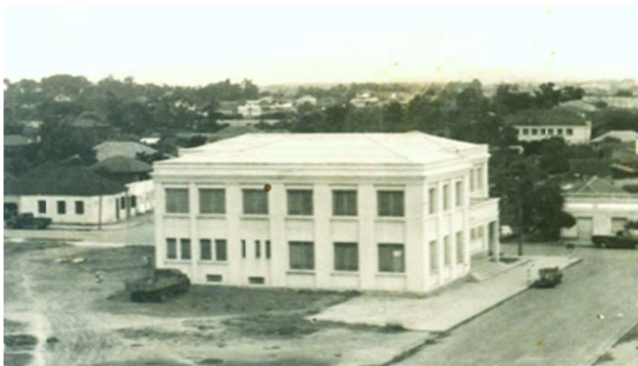
Figura 4: Prédio da Prefeitura de Canoas (1953)

Por algum tempo, o referido logradouro passou a substituir a Praça da Bandeira, defronte à Igreja Matriz de Canoas, como o local de celebrações oficiais da municipalidade.