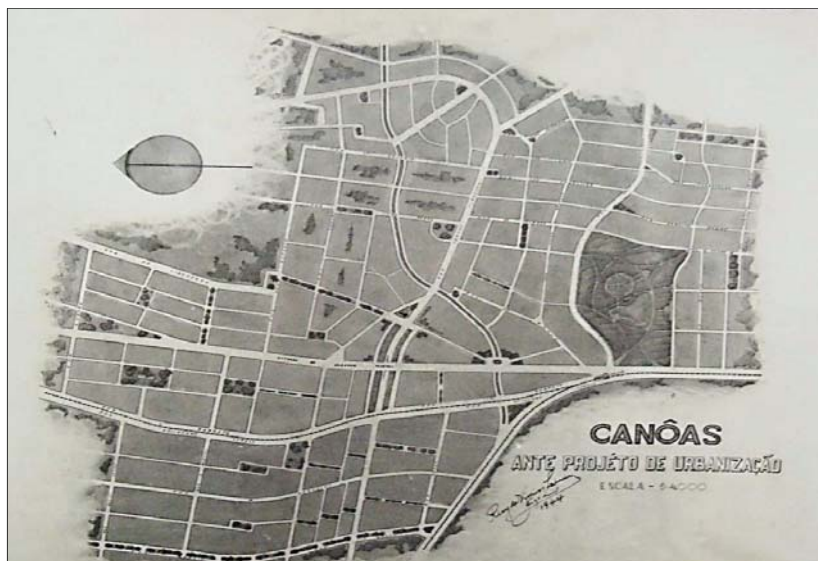
Figura 2: Planta geral do Projeto de Reurbanização de Canoas, 1944.