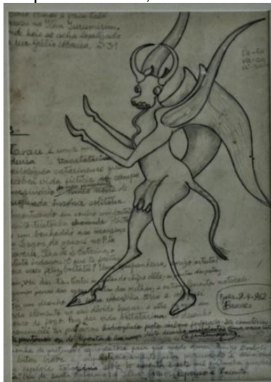
Figura 6 – Tavau , Franklin Joaquim Cascaes, 1962. Grafite sobre papel, 34,6 x 23,0 cm.