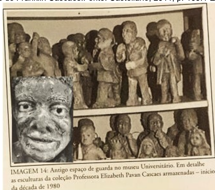
Figura 9 – Esculturas de Franklin Cascaes. / Escultura com craquelê