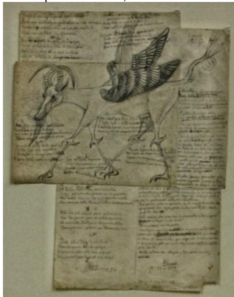
Figura 1 – Boafó, Franklin Joaquim Cascaes, 1973. Grafite sobre papel, 55,4X42,3 cm. 2

Fonte: Coleção Elisabeth Pavan Cascaes. MARquE. Tombo: 673 a