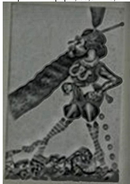
Figura 2 – A Bruxa Grande, Franklin Joaquim Cascaes, 1976. Nanquín sobre papel, 65,0 X 43,1 cm.

Fonte: Coleção Elisabeth Pavan Cascaes. MARquE. Tomb. 241.