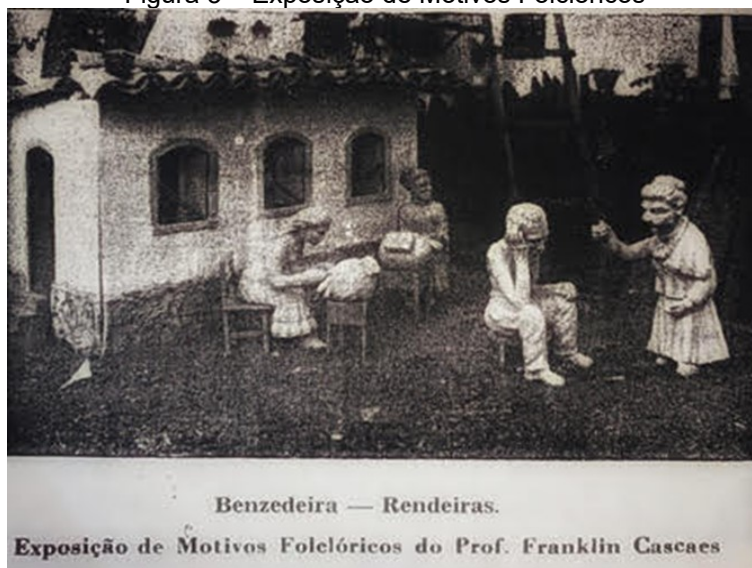
Figura 3 – Exposição de Motivos Folclóricos