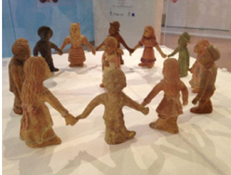
Figura 10: Esculturas. Exposição “Cascaes no MARquE”, 2016.