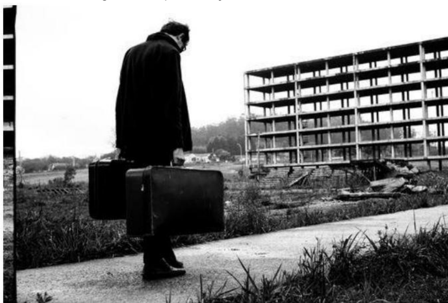
Figura 5: Representação da saída do CRUSP.