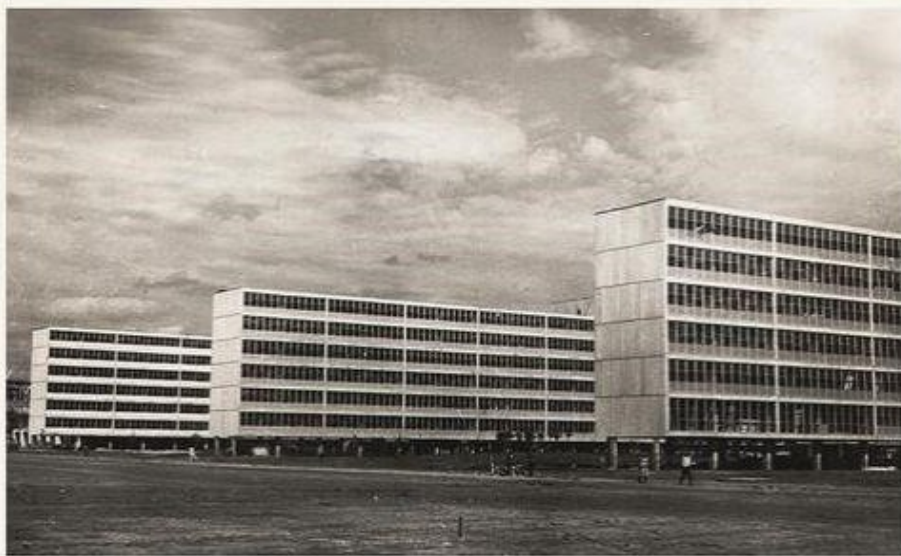
Figura 1: CRUSP, 1963.