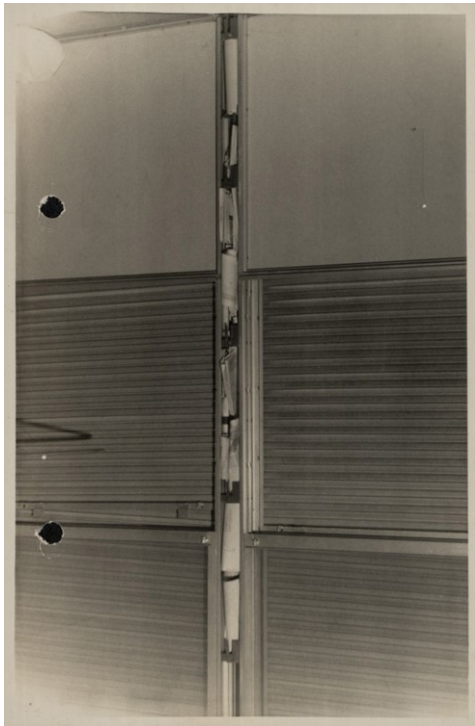
Figura 2: Documentos escondidos em frestas no CRUSP.