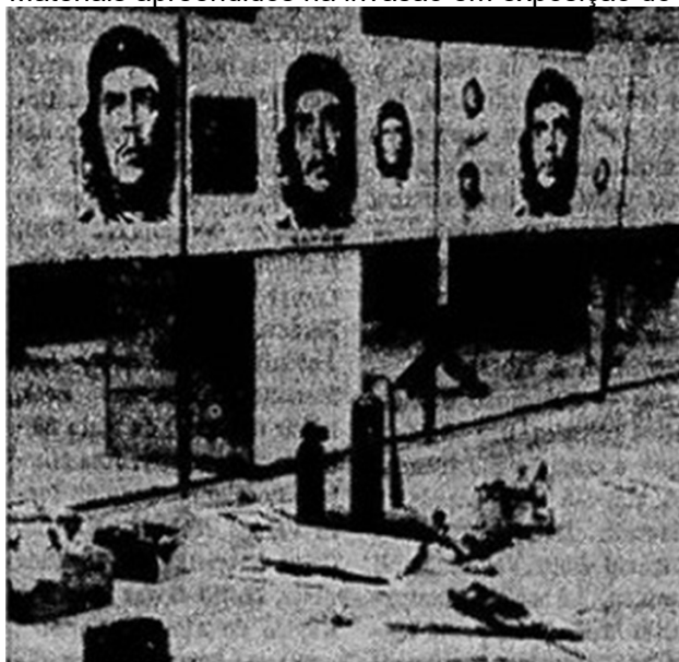
Figura 3: Materiais apreendidos na invasão em exposição do II Exército