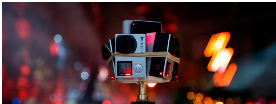
Figura 3 – O Jornalista Imersivo

habilidade importante é representar o ambiente e a notícia via câmeras que são capazes de tirar fotos tridimensionais, gravar vídeos nos formatos de 360 graus e de Realidade Virtual (RV). Tais câmeras também captam áudios para representá-los no formato de sons imersivos (Figura 3). Este jornalista tem um papel promissor, considerando a capacidade que o mesmo deve ter para fazer o público navegar e se ambientar em um nível bem mais realístico de informação.