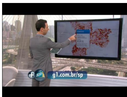
Figuras 1 e 2 – César Tralli apresenta a série Resultado no SPTV 1ª Edição