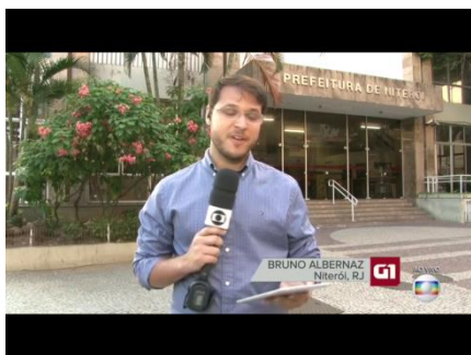
Figuras 3 e 4 – Visualização de dados utilizada na entrada ao vivo de repórter do G1 no Bom Dia Rio.

Em outra série de reportagens, ocorre o contrário: a transmissão direta, própria da linguagem de televisão, é utilizada para dar destaque e atualidade ao trabalho do publicado pelo portal G1. Tal qual um repórter de TV, o profissional sai da redação de internet, seu lugar de fala, e entra ao vivo da rua – para explicar como o telespectador pode acessar o mapa interativo criado pela internet, como mostra, abaixo, a Figura 3. Percebe-se que, aqui, a interatividade é simulada – e torna-se uma imagem -- como mostra a figura 4 – que é veiculada durante a entrada ao vivo para ilustrar o texto do repórter. A matéria foi veiculada no Bom Dia Rio em maio de 2016 e mostra um levantamento feito através de um banco de dados criado pelos repórteres com informações apuradas sobre o pagamento do salário de servidores em atraso devido à crise financeira do Estado.