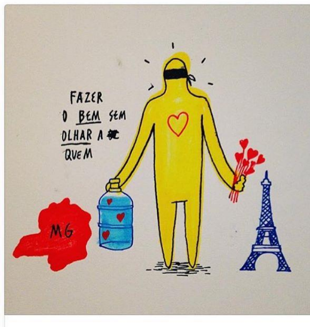
Figura 1 – Imagem com maior incidência da hashtag #SalveMariana

Desde a catástrofe do maior acidente ambiental brasileiro, ocorrido em 05 de novembro de 2015, foram constatadas centenas de interações sociais e práticas de ativismos (posicionamentos comportamentais) na rede a partir da hashtag #SalveMariana no instagram . Também foram encontradas outras hashtags que tratavam sobre o acidente. Dentre elas: #SosMariana, #PrayForMariana, #PrayForMarianaBr. A escolha em analisar #SalveMariana se deu devido ao termo ter um maior apelo popular (informacional e comunicacional) frente às outras.