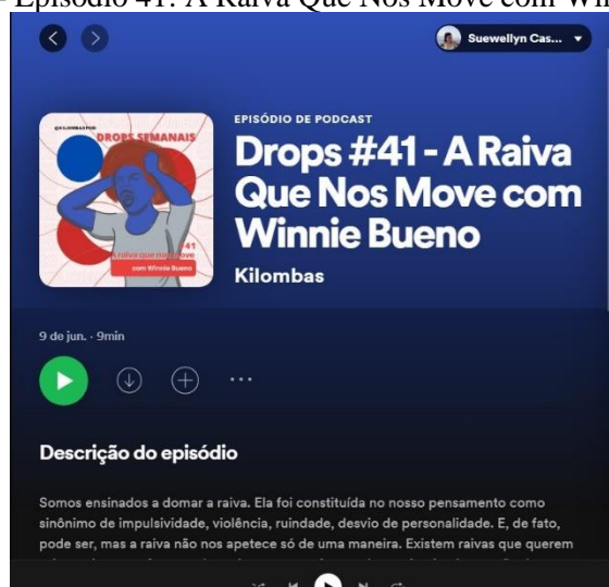
Figura 2 - Episódio 41: A Raiva Que Nos Move com Winnie Bueno

Uma vez que apresentamos aspectos mais gerais sobre o Kilombas , escolhemos nos debruçar sobre um episódio que nos desperta a atenção em particular, o Drops #41 – A Raiva Que Nos Move, Com Winnie Bueno 7 , que foi ao ar no dia 09 de junho de 2021. O podcast trata sobre ressignificar o uso da raiva, conforme Audre Lorde (2020), que nos move a organizá-la ante as violências estruturais e canalizá-las para a transformação da sociedade.