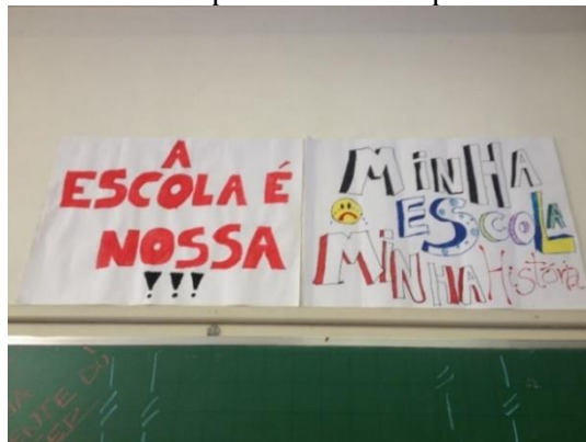
Figura 1 – Cartazes criados pelos alunos e expostos na sala do GECEP

Ao fotografar, usando como instrumento o celular, o objetivo foi, em um primeiro momento, que o registro servisse como apoio para a investigação. Compreendida como antropologia visual (ANDRADE, 2002), a fotografia serve mais do que um documento, prova do que aconteceu ou ilustração do texto escrito, pois a imagem nasce da observação de um contexto carregado de significados. As figuras apresentadas na sequência ilustram o uso da fotografia como instrumento no percurso metodológico desenvolvido com os alunos do Estadual: