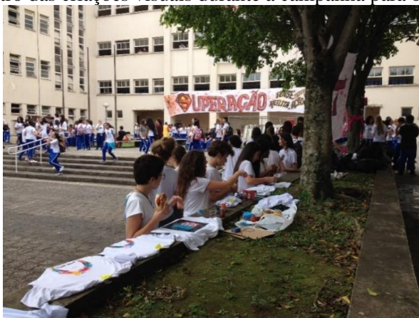
Figura 3 – Registro das criações visuais durante a campanha para o grêmio estudantil