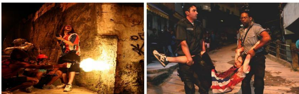
Figura 05 – Cenas do filme Tropa de Elite: Na imagem à esquerda, destaca-se um grupo de traficantes “trocando tiros” com policiais. À direita, uma imagem dos policiais carregando o corpo de um dos traficantes.

Enfim, no filme a favela é retratada como um local que deve ser invadido de forma estratégica pelo BOPE, um cenário de guerra, em que os inimigos devem ser exterminados de qualquer maneira. “ Homem com farda preta entra na favela pra matar, nunca pra morrer ” completa o capitão Nascimento.