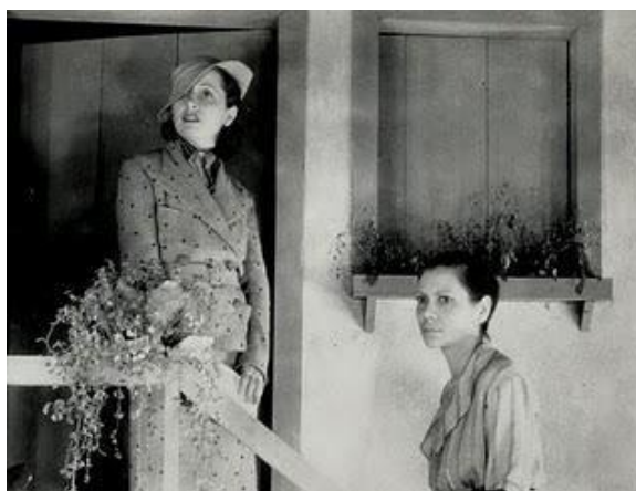
Figura 01 – Cena do filme “Favela dos Meus Amores”

O fato de ser filmado quase que inteiramente no Morro da Providência, fez com o diretor Humberto Mauro fosse classificado como “precursor do neorealismo” por apropriar-se de cenários considerados “autênticos”. Porém, tal autenticidade fez com que o diretor fosse “enquadrado pela polícia”. Os agentes públicos censuraram várias cenas alegando que o filme exibía uma demasiada quantidade de pobres e negros (CINEMETRO, 2016).