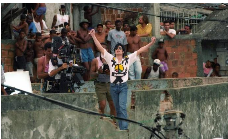
Figura 03 – Michael Jackson na Favela Santa Marta: Michael Jackson durante a gravação de seu clipe musical na Favela Santa Marta

Se a favela já era “velha conhecida” dos brasileiros, na década de 1990, o processo de internacionalização da mesma é intensificado, ampliando dessa forma, sua notoriedade. Em 1996, Michael Jackson resolve gravar o clipe da música “They don’t care about us” (Eles não ligam para nós) na Favela Santa Marta (ver Figura 03), causando assim, um verdadeiro “furor” na cidade. No dia seguinte da gravação das filmagens do clipe, a manchete do jornal O Globo noticiava: “ Traficantes controlam a segurança de Michael Jackson ”, e o subtítulo apresentava o seguinte “ Astro grava videoclipe, conquista os favelados e se apaixona pela cidade ”. A gravação do clipe promoveu forte comoção na favela, muitos moradores se apertaram por entre os becos e vielas com o objetivo de chegar mais próximo do astro pop e conseguir um autógrafo, porém, o acesso ao cantor foi muito restrito, já que sua chegada à favela – por meio de um helicóptero – foi cercada por dezenas de seguranças e policiais. “ Ao contrário do que temiam alguns políticos, a filmagem foi uma celebração no Morro. O Dona Marta mostrou que também é pop ” completa a reportagem (O Globo, 1996, p.09).