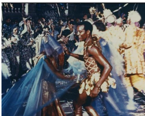
Figura 02 – Cena do filme “Orfeu Negro”: Orfeu Negro, o protagonista do filme, sambando durante o desfile de carnaval.

No filme existe uma conexão imediata com o samba, a cada corte de cena os personagens aparecem dançando. Aliás, o vínculo do samba com os moradores de favela é uma marca da película, com várias pessoas formando rodas de samba, sendo que no interior delas várias mulheres negras são exibidas dançando freneticamente. Enfim, a favela foi delineada como o “reino da alegria”.