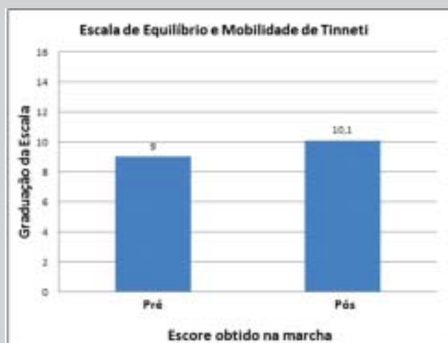
Figura 1. Escore obtido na avaliação pré e pós-tratamento em relação à marcha dos idosos (n=20) participantes de um grupo de convivência na cidade de Uiraúna, Paraíba, Brasil 2013