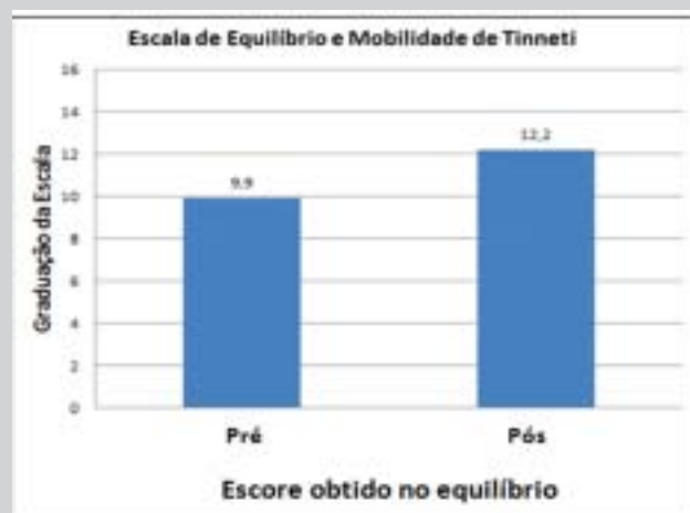
Figura 2. Escore obtido na avaliação pré e pós-tratamento em relação ao equilíbrio dos idosos (n=20) participantes de um grupo de convivência na cidade de Uiraúna, Paraíba, Brasil 2013.